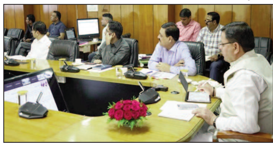
सीएम पुष्कर सिंह धामी सचिवालय से वर्चुअल माध्यम से बैठक में प्रतिभाग करते हुए।

जयन्त प्रतिनिधि। देहरादून : मुख्यमंत्री पुष्कर सिंह धामी ने केन्द्रीय वित्त मंत्री, श्रीमती निर्मला सीतारमण की अध्यक्षता में आयोजित राष्ट्रीय औद्योगिक कॉरिडोर विकास और कार्यान्वयन ट्रस्ट की शीर्ष मानिटरिंग अथॉरिटी की दूसरी बैठक में सचिवालय से वर्चुअल माध्यम से प्रतिभाग किया। उन्होंने उत्तराखण्ड के किच्छा तहसील के अन्तर्गत लगभग 1000 एकड़ पर विकसित किये जाने वाले अमृतसर-कोलकाता इंटरस्ट्रियल कॉरिडोर प्रोजेक्ट के लिए प्रधानमंत्री श्री नरेन्द्र मोदी एवं केन्द्र सरकार का आभार व्यक्त किया। मुख्यमंत्री ने कहा कि इस परियोजना में लगभग 7500 करोड़ का प्रत्यक्ष निवेश व युवाओं के लिए लगभग 20000 रोजगार के नये अवसर सृजित होंगे। कहा कि राज्य सरकार द्वारा इस परियोजना के लिए स्पेशल पर्पज व्हीकल (एसपीवी) का भूमि लीज पर दिये जाने हेतु सिडक को उपलब्ध