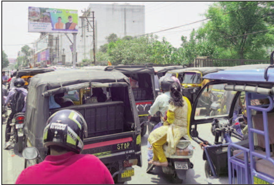
कैशन: कोटद्वार के देवी रोड में लगा वाहनों का लंबा जाम

गढ़वाल के प्रवेश द्वार कोटद्वार में यातायात व्यवस्था लगातार बेपट्टी होती जा रही है। लाख प्रयासों के बाद भी