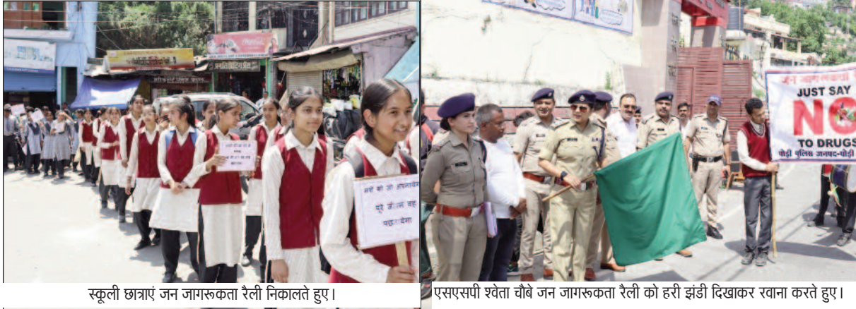
स्कूली छात्राएं जन जागरूकता रैली निकालते हुए।