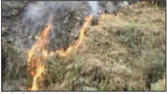
लैंसडौन वन प्रभाग के जंगलों में लगी आग से उठता धुआं

जयन्त प्रतिनिधि। कोटद्वार : गर्मी बढ़ने के साथ ही जंगलों में आग लगने की घटनाएं बढ़ने लगी हैं। लैंसडौन वन प्रभाग क्षेत्र के साथ ही आसपास के जंगल लगातार धधक रहे हैं। जंगल की आग से सैकड़ों किलोमीटर में फैली वन संपदा जलकर खाक हो गई। पिछले कई दिनों से लैंसडौन वन प्रभाग क्षेत्र के अंतर्गत कोटद्वार, लैंसडौन व दुग्गुल रेंज के जंगलों में आग लगी हुई है। धीरे-धीरे यह आग विकराल रूप धारण करने लगी है। सिद्धबली मंदिर के समीप भी पहाड़ियां धधकती रही। सिलोगी, जदला, दुग्गुल, लैंसडौन सहित आसपास के क्षेत्र में लगातार आग बढ़ती जा रही है। विकराल होती आग के आगे वन विभाग भी हिम्मत हार चुका है। चौतरफा आग के कारण वन्य जीवों की सुरक्षा को खतरा पैदा हो गया है। हालांकि, वन विभाग की ओर से आग पर काबू पाने के लिए वन कर्मी व फायर वाचर तैनात किए गए हैं। लेकिन, वह भी आग को बुझाने में नाकाम साबित हो रहे हैं। ऐसे में अब वन विभाग आग पर काबू पाने के लिए बारिश का इंतजार कर रहा है।