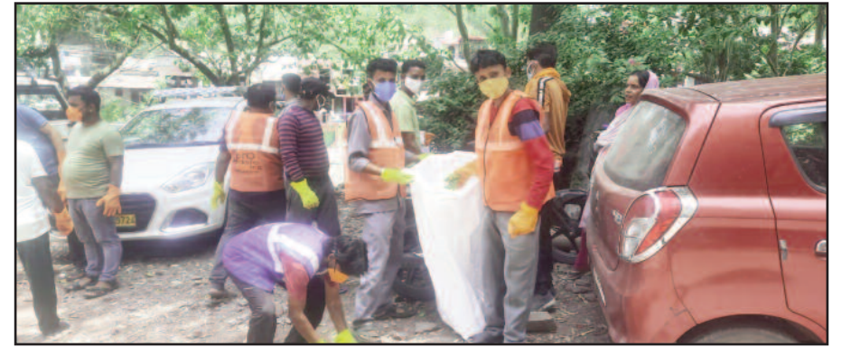
दुग्ढा क्षेत्र में स्वच्छता अभियान चलाते पालिका कर्मी ।

जयन्त प्रतिनिधि। कोटद्वार : नगर पालिका दुग्ढा की ओर से वाई वासियों को स्वच्छता की शपथ दिलवाई गई। इस दौरान नगर निगम ने वाडों में स्वच्छता अभियान चलाते हुए कूड़ा एकत्रित कर उसे नष्ट किया। जिलाधिकारी के आदेश पर नगर निगम की ओर से स्वच्छता