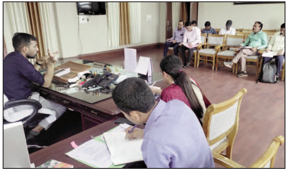
डीएम डॉ. आशीष चौहान बैठक में अधिकारियों को निर्देश देते हुए।

थे। इसी दौरान खांडवूसैण के पास अंछरीखाल के पास सवारियों से