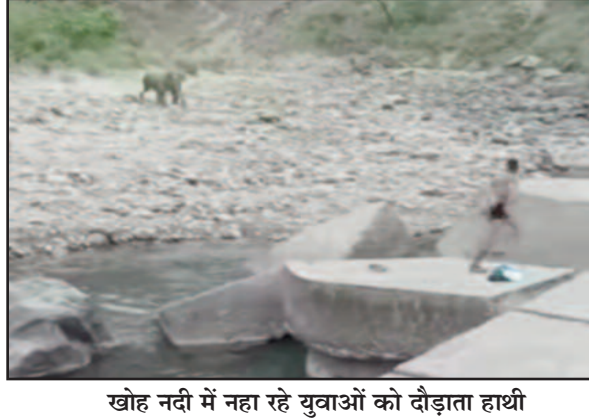
खोह नदी में नहा रहे युवाओं को दौड़ाता हाथी

जयन्त प्रतिनिधि कोटद्वार : यदि आप खोह नदी में नहाने जा रहे हैं तो जरा सावधान हो जाएं। दरसअल, इन दिनों भीषण गर्मी से जंगलों के अधिकांश प्राकृतिक स्रोत सूख चुके हैं। ऐसे में हाथी जंगल से निकलकर खोह नदी में पानी पीने के लिए पहुंच रहे हैं। खोह नदी में नहाने के लिए पहुंचे युवाओं को हाथी ने खूब दौड़ाया। यही नहीं हाथी काफी देर तक नदी में ही टहलता रहा।