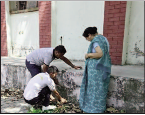
महाविद्यालय परिसर में स्वच्छता अभियान चलाते विद्यार्थी

कहा कि समाज को स्वच्छ व स्वस्थ बनाने की जिम्मेदारी प्रत्येक नागरिक की है। इस मौके