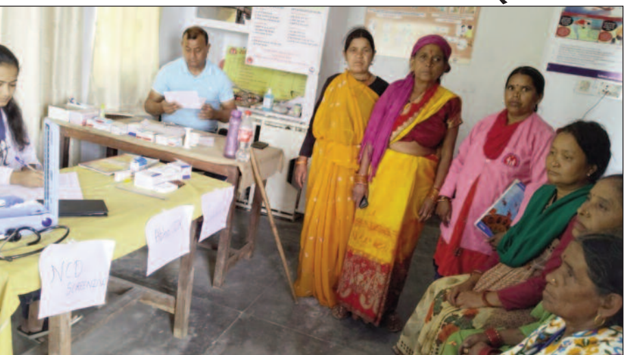
स्वास्थ्य मेले में जांच कराने के लिए आई महिलाएं।

जयन्त प्रतिनिधि। पौड़ी : स्वास्थ्य विभाग की ओर से बुधवार को जनपद के सभी हेल्थ एण्ड वेलनेस सेंटरों में स्वास्थ्य मेले का आयोजन किया गया। इस दौरान शिविर में आये लोगों की चिकित्सकीय टीमों के माध्यम से डायबिटीज, हाइपरटेंशन, मेंटल हेल्थ, ओरल हेल्थ की स्क्रीनिंग की गई। साथ ही शिविर में आये लोगों को योगा, मेडीटेशन करवाने के साथ ही आभा आईडी भी बनाई गई।