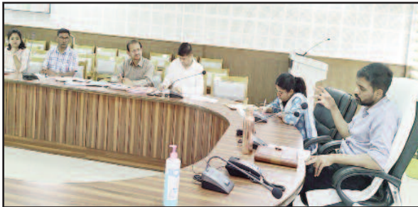
डीएम डॉ. आशीष चौहान बैठक में अधिकारियों को निर्देश देते हुए।

जिलाधिकारी ने कहा कि प्रत्येक माह के लिए दिये गये लक्ष्यों के सापेक्ष कार्यों में तेजी लाते हुए पूर्ण करें। जल जीवन मिशन के जो कार्य पूर्ण हो चुके हैं उनका फोटोग्राफ्स सहित पोर्टल पर अपलोड करना करें। जिलाधिकारी ने माह अप्रैल व जून तक 5 करोड़ से अधिक वाली योजनाओं में 6345