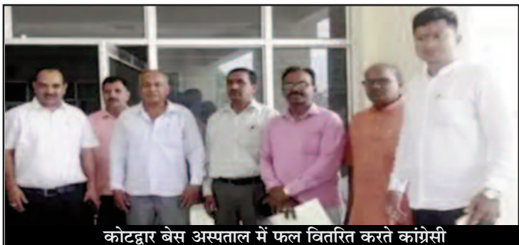
कोटद्वार बेस अस्पताल में फल वितरित करते कांग्रेसी