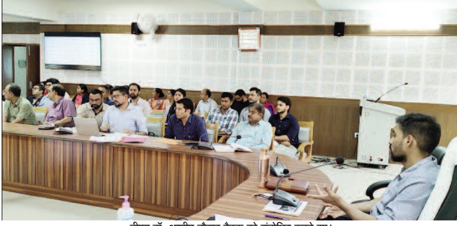
डीएम डॉ. आशीष चौहान बैठक को संबोधित करते हुए।

आशा व आंगनवाडी वर्कर्स को लेकर स्पष्ट किया कि वे किसी भी समय किसी भी गांव