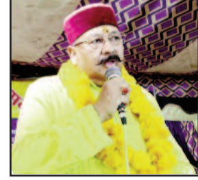
प्रदेश के पर्यटन, धर्मस्व एवं संस्कृति मंत्री सतपाल महाराज