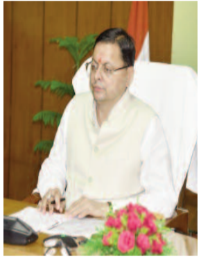
सीएम पुष्कर सिंह धामी वेद शास्त्र अनुसंधान का वर्चुअल शुभारंभ करते हुए।

सीएम ने किया वेद शास्त्र अनुसंधान का वर्चुअल शुभारंभ