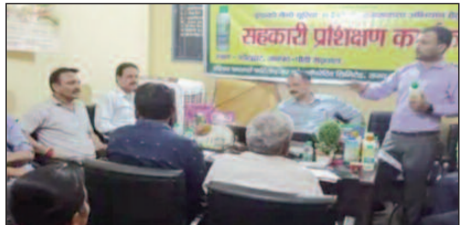
आयोजित कार्यक्रम में जानकारी देते विशेषज्ञ

नैनो यूरिया बेहतर पोषण के साथ उत्पादन बढ़ाता है और रसायनिक उर्वरकों के उपयोग में भी कमी लाता है। यह जल, वायु और मृदा प्रदूषण को कम करता है जिससे भूमिगत जल और मिट्टी की गुणवत्ता पर बहुत अच्छा प्रभाव पड़ता है। तत्पर इफको नैनो यूरिया को पौधों के पोषण के लिए प्रभावी पाया गया है। नैनो