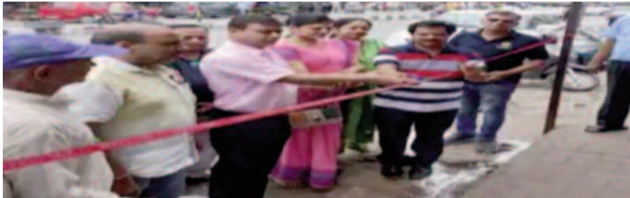
तीलू रौतेला चौक पर रिबन काटकर पेयजल टंकी का शुभारंभ करते अतिथि

नगर आयुक्त ने रोटरी क्लब की ओर से जनसरोकारों के लिए किए गए कार्य की सराहना की। कहा कि यात्री शोड के निर्माण से लोगों को धूप व बरसात से बचने के लिए स्थान मिलेगा। साथ टंकियों के निर्माण से राहगीरों को पीने के पानी की सुविधा मिलेगी।