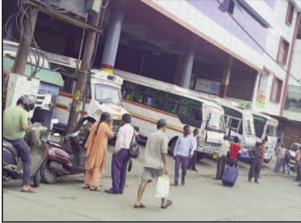
कोटद्वार के जीएमओयू बस अट्टे में पहाड़ी रूट के लिए खड़ी बसें

यही नहीं यात्रियों की इस मजबूरी का सबसे अधिक