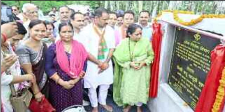
कोटद्वार में पुल का लोकार्पण करती विस अध्यक्ष ।

पुल का लोकार्पण होने से लोगों की बहुत पुरानी मांग पूरी हो गई है। यह पुल कोटद्वार और भाबर को जोड़ेगा साथ ही इससे पुल से निर्माण से कण्वाश्रम के विकास की संभावनाएं बढ़ेंगी।