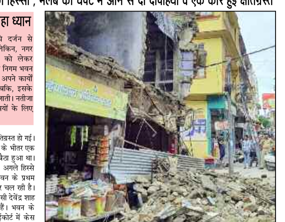
कोटद्वार स्टेशन रोड में धराशायी हुआ गिरासू भवन