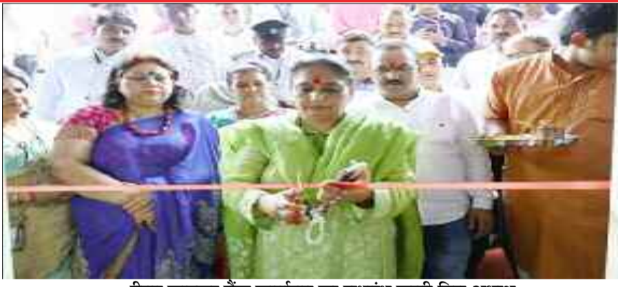
रीबन काटकर बैंक कार्यालय का शुभारंभ करती विस अध्यक्ष

कोटद्वार : विधानसभा अध्यक्ष ऋतु खंडूडी भूषण ने कहा कि जिला सहकारी बैंक सरकारी योजनाओं के माध्यम से लोगों को स्वरोजगार से जोड़ रहा है। अधिक से अधिक लोगों तक योजनाएं पहुंचे इसके लिए हर संभव प्रयास किए जा रहे हैं। कोटद्वार के देवी रोड स्थित जिला सहकारी बैंक लि0 गढ़वाल की शाखा का शुभारंभ विधानसभा अध्यक्ष ऋतु खंडूडी सभी विद्यालयों के बच्चों को प्रवेश भूषण ने किया। उन्होंने बैंक कर्मियों को शाखा की शुभकामनाएं देते हुए क्षेत्र के विकास में योगदान देने को कहा। कहा कि सहकारी बैंकों का महत्व विशेष है, वे सामाजिक