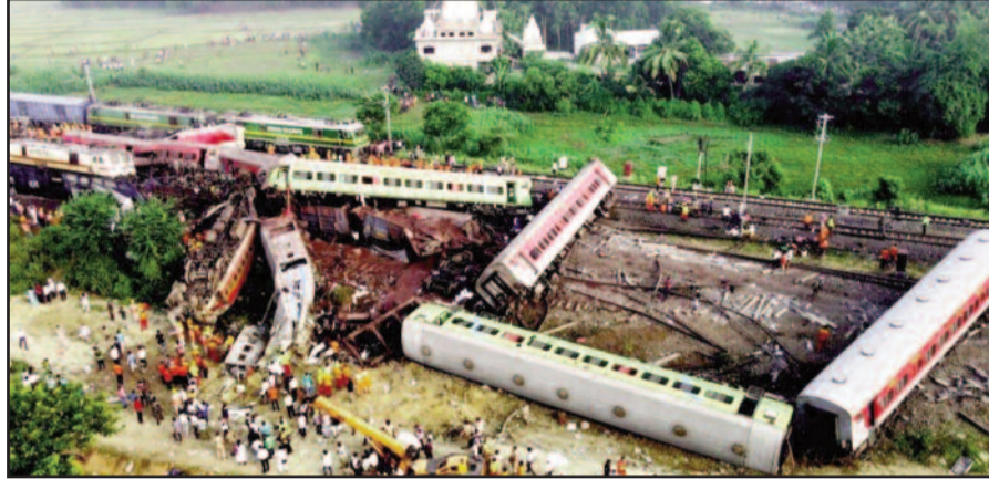
बालासोर जिले में कोरोमंडल एक्सप्रेस, बेंगलुरु-हावड़ा एक्सप्रेस और एक मालगाड़ी के पटरी से उतरने की जगह पर बचाव अभियान चल रहा है। अधिकारियों के अनुसार कम से कम 233 लोग मारे गए और 900 अन्य घायल हो गए।

ओडिशा स्वास्थ्य विभाग के मुताबिक, अबतक 1175 मरीजों को निजी अस्पतालों में भर्ती कराया गया था, जिनमें से 793 मरीजों को छुट्टी दे दी गई है, जबकि 382 मरीज अस्पताल में हैं, जिनमें से 2 की हालत गंभीर है, बाकी सभी की हालत स्थिर है। तमिलनाडु के मुख्यमंत्री एमके स्टालिन के बेटे और युवा कल्याण एवं खेल मंत्री उदयनिधि स्टालिन ने ओडिशा के मुख्यमंत्री नवीन पटनायक से मुलाकात की। इस दौरान तमिलनाडु के परिवहन मंत्री एसएस शिवशंकर भी मौजूद