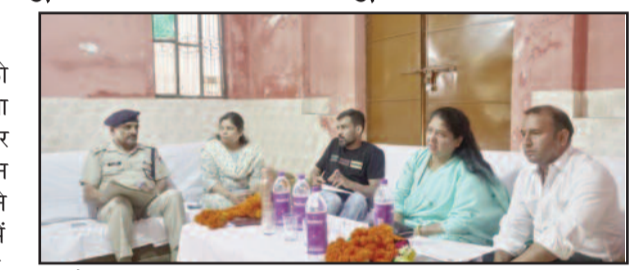
बैठक को संबोधित करते हुए यमकेश्वर विधायक रेनु बिष्ट।

जिलाधिकारी ने संबंधित अधिकारियों को कांवड़ यात्रा के दौरान कंट्रोल रूम स्थापित करने, सौरभ व्यवस्था को दुरुस्त करने के लिए अतिरिक्त व्यवस्था,