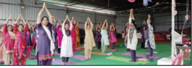
कोटद्वार में आयोजित योग कक्षा में योगाभ्यास करते क्षेत्रवासी

जयन्त प्रतिनिधि कोटद्वार : भारत स्वाभिमान न्यास पतंजलि परिवार की ओर से न्यू एरा पब्लिक स्कूल लालपानी व भाबर के हल्दूखाता स्थित एक बारातघर में पांच दिवसीय निःशुल्क योग शिविर आरंभ हो गया है। शिविर में लोगों को विभिन्न प्रकार के योग व ध्यान कराये गये। इस दौरान योग शिक्षकों ने लोगों से हर रोज सूर्योदय से पूर्व उठकर योगाभ्यास करने की अपील की।