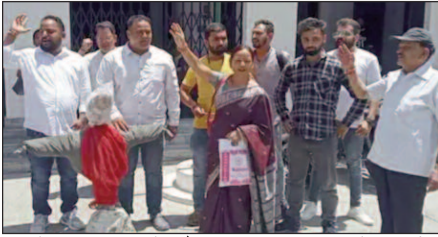
कोटद्वार नगर निगम परिसर में महापौर व नगर आयुक्त का पुतला दहन करते भाजपा पार्श्व

गुरुवार को पार्श्वों ने नगर निगम परिसर में पुतला दहन किया। कहा कि नगर निगम की ओर से देवी रोड़ स्थित स्टेट बैंक के समीप खड़े वाहनों से पार्किंग शुल्क लेना आरंभ कर दिया गया है। साथ ही तहसील परिसर से राजकीय बेस चिकित्सालय तक सड़क के किनारे पार्किंग होने वाले वाहनों से भी पार्किंग शुल्क लेने की योजना बनाई जा रही है, जिसका वे विरोध करते हैं। कहा