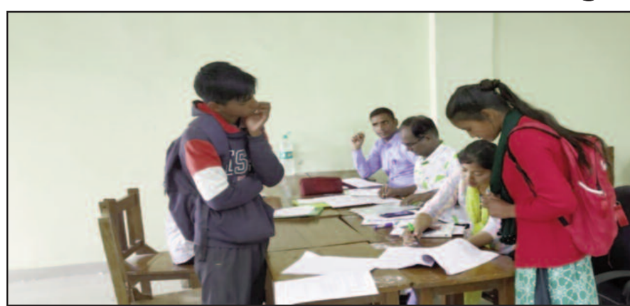
राजकीय महाविद्यालय थलीसैण में प्रवेश प्रक्रिया की जानकारी लेते हुए छात्रा।

जयन्त प्रतिनिधि। थलीसैण : राजकीय स्नातकोत्तर महाविद्यालय थलीसैण में सोमवार से समर्थ पोर्टल के जरिए स्नातक कक्षाओं में प्रवेश प्रक्रिया शुरू हो गई। प्राचार्य ने प्रवेश लेने के इच्छुक छात्र-छात्राओं से निर्धारित तिथि तक प्रवेश लेने की अपील की है। सोमवार को बीए व बीएससी