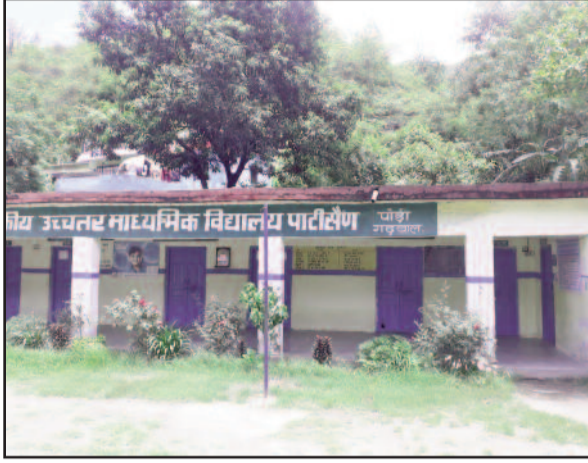
जीर्ण-शीर्ण अवस्था में खड़ा विद्यालय का भवन

अस्सी के दशक में राजकीय हाईस्कूल पाटीसैण के भवन का निर्माण करवाया गया था।