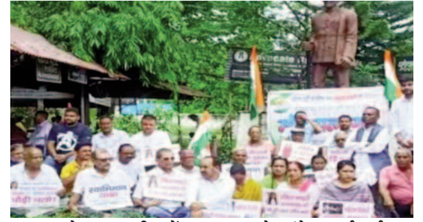
कोटद्वार तहसील में सत्याग्रह करते कांग्रेस कार्यकर्ता

केंद्र व प्रदेश सरकार पर लगाया जनता के शोषण का आरोप