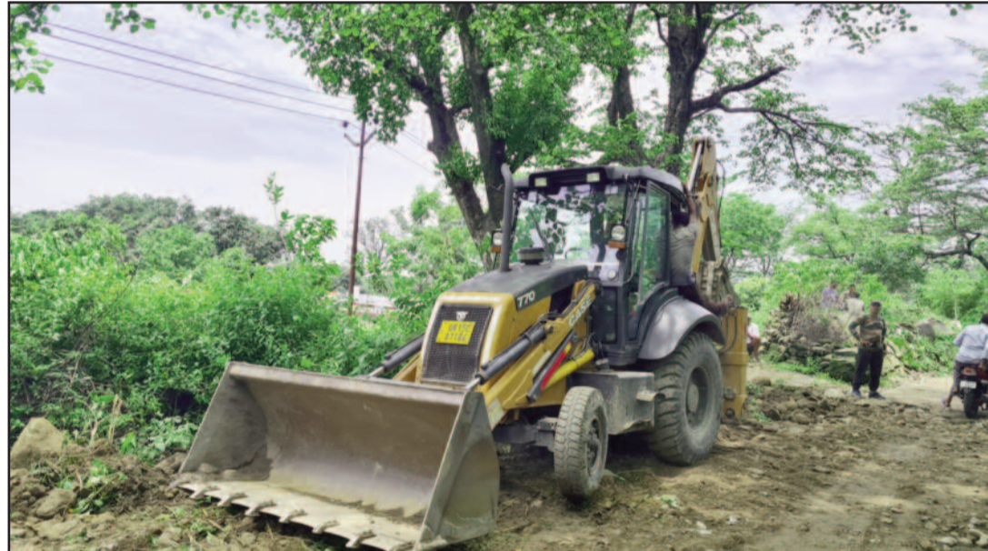
कण्वाश्रम-धुवपुर मार्ग पर व्यवस्थाओं को बेहतर बनाती जेसीबी