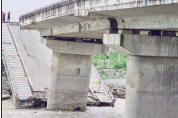
मालन नदी का धराशायी पुल

पुल के पिल्लरों की हालत बिगड़ने के बाद लोक निर्माण विभाग ने बजट के लिए शासन से मांग की। लेकिन, शासन ने भी इसे मंजूरी नहीं दी। नतीजा शहरवासियों के दिमाग में अब भी यह सवाल घूम रहा है कि आखिर पुल गिरने के लिए कौन जिम्मेदार है। वह विभाग जो अवैध खनन को देखने के बाद