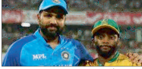
दूसरा टेस्ट: 03 जनवरी - 07 जनवरी - न्यूलैंड्स क्रिकेट ग्राउंड, केंप टाउन

पहला टेस्ट: 26 दिसंबर - 30 दिसंबर - सुपरस्पॉर्ट पार्क, सेंचुरियन