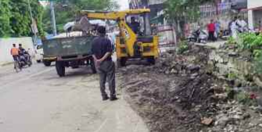
कोटद्वार में राष्ट्रीय राजमार्ग पर मुख्य डाकघर के बाहर सड़क पेड़ को हटाती प्रशासन की टीम

जयन्त प्रतिनिधि कोटद्वार : बदरीनाथ मार्ग मुख्य डाक घर के बाहर राष्ट्रीय राजमार्ग पर लटक रहे पेड़ के तने की आखिर प्रशासन ने सुध ले ही ली। शनिवार शाम एसडीआरएफ और नगर निगम ने सड़क की ओर से लटकते पेड़ के तने को हटा दिया। बदरीनाथ मार्ग पर मुख्य डाकघर के बाहर राष्ट्रीय राजमार्ग पर लटक रहा पेड़ का हिस्सा राह चलते लोगों के लिए खतरा बना हुआ है। सबसे अधिक दुर्घटनाओं का डर रात के समय बना हुआ है। क्षेत्रीय जनता पिछले एक सप्ताह से पेड़ के हिस्से को हटाने की मांग उठा रही थी। लेकिन, प्रशासन की