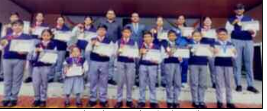
प्रतियोगिता में उत्कृष्ट प्रदर्शन करने वाले विद्यार्थी