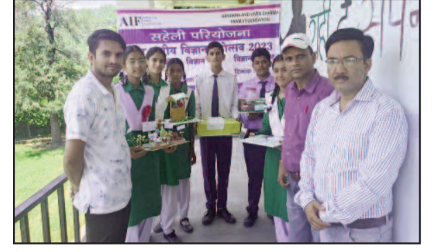
मॉडल प्रतियोगिता में प्रतिभाग करते विद्यार्थी