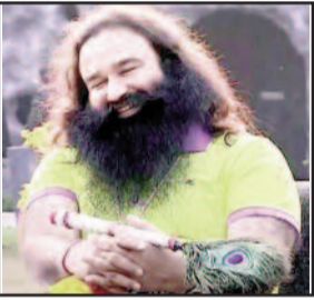
बरनावा आश्रम में रहना होगा

नई दिल्ली, एजेंसी। दुष्कर्म और हत्या मामले में उग्रकैद की सजा काट रहे डेरा सच्चा सौदा प्रमुख राम रहीम को एक बार फिर 30 दिन की पैरोल मिल गई है। जेल प्रशासन ने राम रहीम को सिरसा डेरे में जाने की इजाजत नहीं दी है। एक बार फिर उसे यूपी के बागपत में स्थिति बरनावा आश्रम में रहना पड़ेगा, जिसको लेकर बरनावा आश्रम की सुरक्षा बढ़ाई गई है और सिरसा से छोड़े और गाय पहुंचाई गई है। राम रहीम को सजा के दौरान मिली यह सातवीं पैरोल है। यहीं नहीं, इसी साल जनवरी में राम रहीम को 40 दिन की पैरोल मिली थी। उधर, शिरोमणि गुरुद्वारा प्रबंधक कमेटी के अध्यक्ष एडवोकेट हरजिंदर सिंह धामी ने हत्या और दुष्कर्म जैसे संगीन आरोपों के तहत जेल में सजा काट रहे डेरा सिरसा प्रमुख गुरुमीत राम रहीम को एक बार फिर 30 दिन की पैरोल मिलने पर कड़ा एतराज