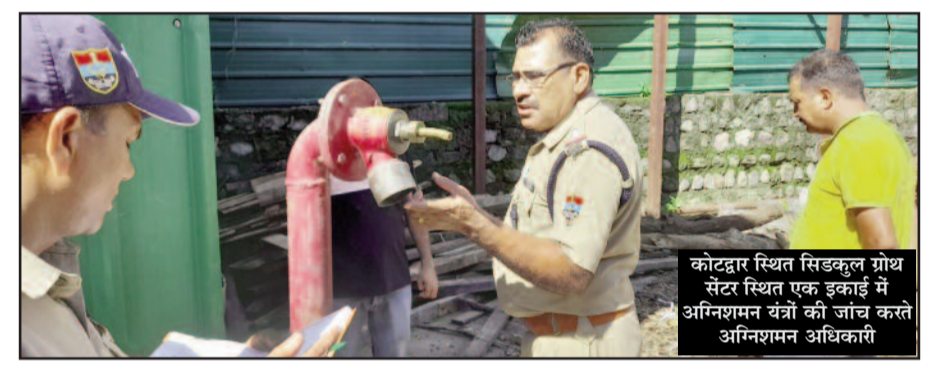
कोटद्वार स्थित सिडकुल ग्रोथ सेंटर स्थित एक इकाई में अभिनशन वंत्रों की जांच करते अभिनशन अधिकारी