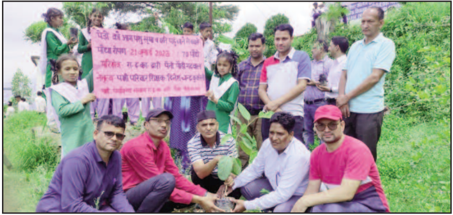
राजकीय इंटर कॉलेज द्वारी में पौधा रोपते हुए शिक्षक एवं छात्र।