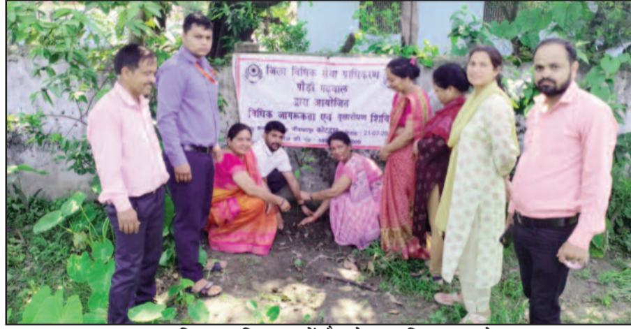
राकउमा विद्यालय शिराजपुर में पौध रोपण अभियान चलाते सदस्य