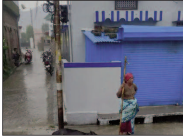
जौनपुर मोहल्ले में करंट लगने से हुई बकरी की मौत

कोटद्वार : बरसात के दौरान सड़क व मोहल्लों में खड़े ऊर्जा निगम के विद्युत पोल खतरा बन रहे हैं। शुक्रवार को जौनपुर मोहल्ले में विद्युत पोल में फैले करंट की चपेट में आने से एक बकरी की मौत हो गई। गनीमत यह रही कि आसपास कोई व्यक्ति या बच्चा मौजूद नहीं था। जिससे एक बड़ी हादसा होने से बच गया।