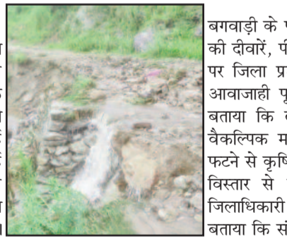
भारी बारिश से थलीसैण के रौली गांव में बही सड़क।