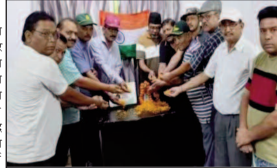
कोटद्वार में शहीदों को श्रद्धांजलि देते कांग्रेसी

जयन्त प्रतिनिधि। कोटद्वार : जिला कांग्रेस कमेटी की ओर से कारगिल शहीद दिवस पर कार्यक्रम का आयोजन किया गया। इस दौरान वक्ताओं ने कारगिल युद्ध में शहीद जवानों को श्रद्धांजलि अर्पित की। पार्टी कार्यालय में आयोजित कार्यक्रम में वक्ताओं ने