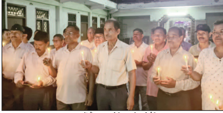
शहर में कैडल मार्च निकालते पूर्व सैनिक