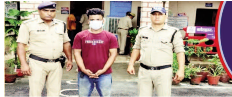
कोटद्वार कोतवाली पुलिस की हिरासत में युवक

पूछताछ में युवक ने बताया कि वह उत्तर प्रदेश के बरेली से