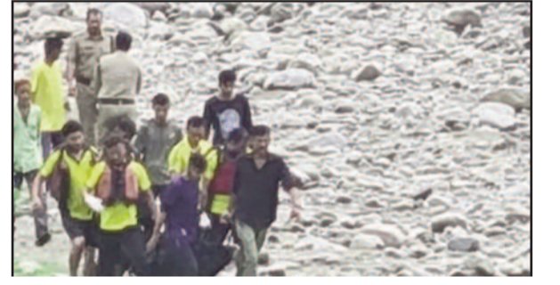
कोटद्वार के खोह नदी से बरामद शव को बाहर लेकर आती पुलिस व एसडीआरएफ की टीम