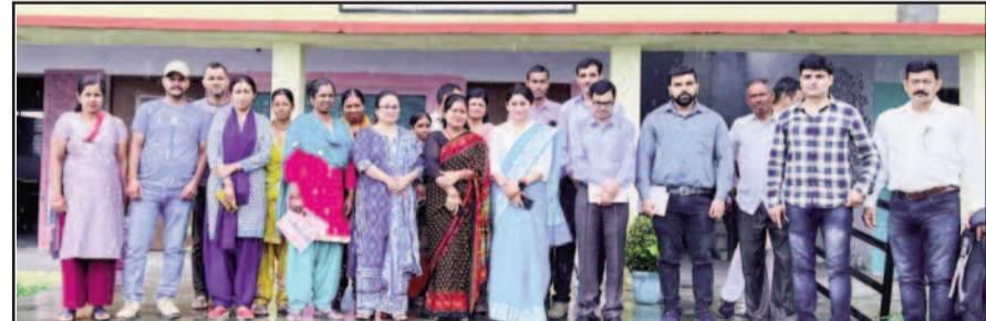
दुगड्डा ब्लाक के ग्राम मथाण में आयोजित बहुदेशीय शिविर में भाग लेते सदस्य

दुगड्डा ब्लाक के अंतर्गत ग्राम मथाण में आयोजित किया गया शिविर