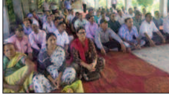
कोटद्वार तहसील में अनशन पर बैठे पूर्व सैनिक

जयन्त प्रतिनिधि कोटद्वार: वेतन विसंगतियों को दूर करने के लिए पूर्व सैनिकों ने तहसील में एक दिवसीय अनशन किया। पूर्व सैनिकों ने केंद्र सरकार पर उनकी अनदेखी का भी आरोप लगाया। कहा कि सरकार पूर्व सैनिकान झेलना पड़ रहा है। 20 फरवरी से पूर्व सैनिक लगातार धरना-प्रदर्शन कर सरकार को जगाने का कार्य कर रहे हैं।