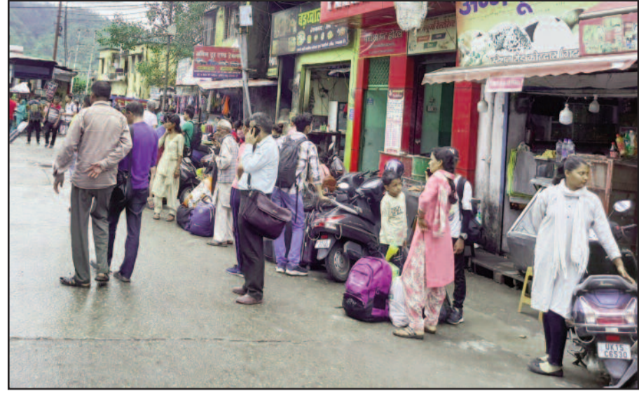
कोटद्वार बस स्टेशन में बस के इंतजार में खड़े यात्री