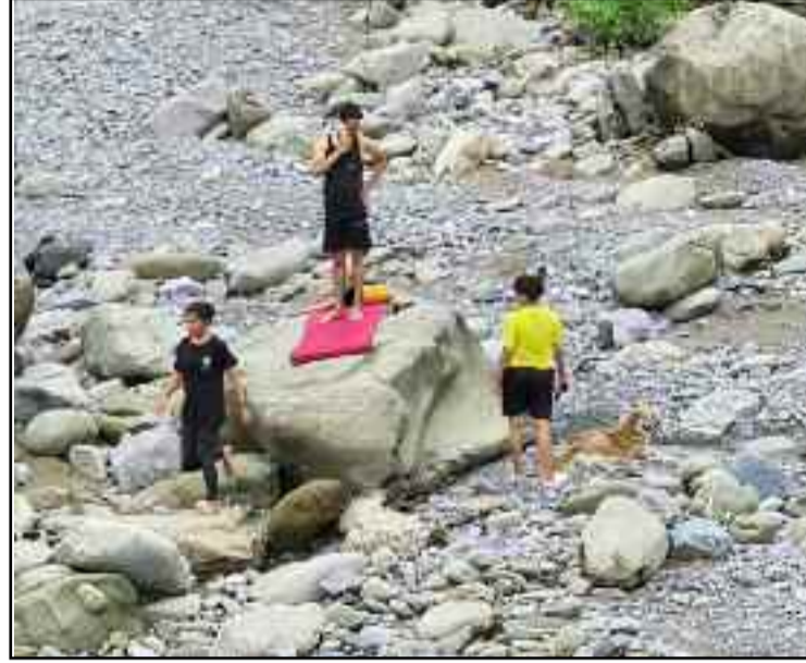
कोटद्वार में नदी के बीच योग व व्यायाम करने पहुंचे युवा।

पिछले 15 दिन के भीतर खोह नदी में डूबने से चार युवकों की मौत भी हो चुकी है। बावजूद क्षेत्रवासी नदी के बीच जाने से नहीं रुक रहे। रविवार सुबह कई युवा कण्वाश्रम स्थित मालिनी नदी के बीच पहुंचकर योगाभ्यास व व्यायाम कर रहे थे। अपने बेहतर स्वास्थ्य की चिंता कर रहे यह युवा नदी के बीच पहुंचकर जिंदगी दांव पर लगा रहे हैं।