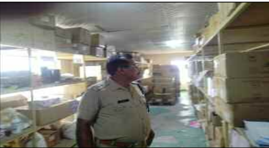
कोटद्वार के भाबर में औद्योगिक संस्थानों में लगे अग्निशमन उपकरणों की जांच करते अधिकारी

कहा कि प्रत्येक व्यक्ति को अग्निशमन उपकरणों की जानकारी होनी आवश्यक है।