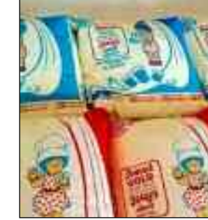
अमूल, मदन डेयरी के साथ होगी ट्रेटर आंचल ब्रांड की ट्रेटर अमूल और मदन डेयरी के साथ होगी। इस वक्त उत्तराखंड के बाजार में इन दो कंपनियों की हिस्सेदारी ज्यादा है। पर्वतीय क्षेत्रों में सामान्य पैकिंग के दूध के साथ साथ ट्रेटा पैक दूध की भी काफी मांग है। खासकर यात्रा सीजन के दौरान इसकी मांग ज्यादा बढ़ जाती है। ट्रेटा पैक में दुग्ध उत्पादों के लंबे समय तक सुरक्षित रहने से