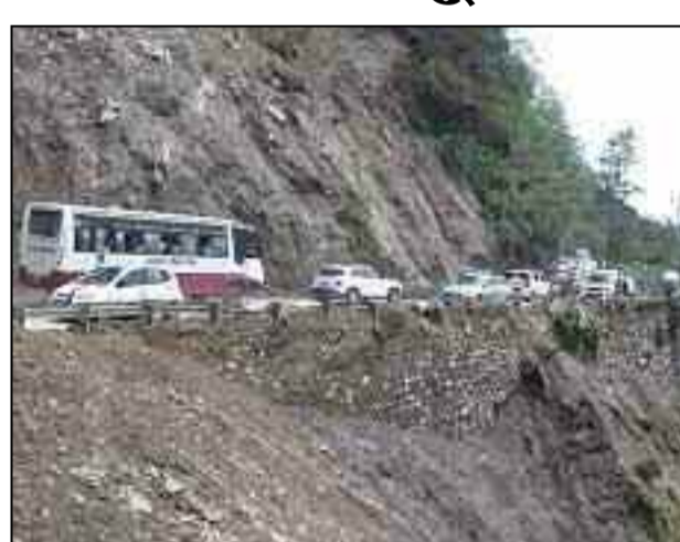
आधे घंटे बाद लोक निर्माण विभाग ने मौके पर जेसीबी भेजकर

देहरादून। मसूरी-देहरादून मार्ग पर रविवार शाम चार बजे भारी बारिश के बीच भूस्खलन हो गया। यहां पानी बँड के समीप सड़क काफी देर तक बाधित रही। बाद में जेसीबी की मदद से मलबा हटाकर यातायात चालू किया गया। रविवार शाम को पानी बँड के समीप भूस्खलन होने से मार्ग के दोनों ओर वाहनों की लंबी लाइन लग गई। इससे पर्यटकों के साथ ही स्थानीय निवासियों को भारी असुविधाओं का सामना करना पड़ा। मलबे के बीच ही लोगों ने रास्ता बनाकर एक तरफ के वाहनों को रोककर दूसरे तरफ से वाहनों का संचालन शुरू किया। करीब