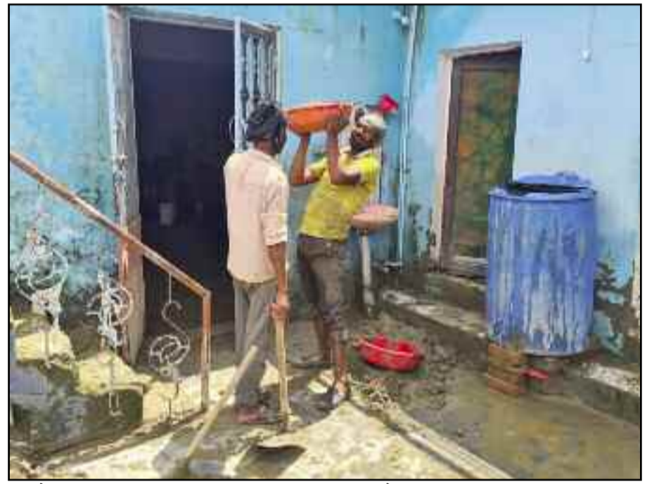
कौड़िया बस्ती में श्रमिकों की मदद से घर के आंगन में फैल मलबे को साफ करते परिवार जन

सामान पूरी तरह खराब हो चुका है। साथ ही कई सामान अब भी मलबे के नीचे दबा हुआ था। घर के आंगन व रास्तों में भारी मलबा जमा हुआ है। बस्ती में फैली अव्यवस्थाओं के कारण कई परिवार अपने रिश्तेदार व परिचितों के घर शरण ले ली है। वहीं, बस्ती में चारों ओर फैली गंदगी व मलबे से कोई बीमारी न हो इसके लिए मौके पर स्वास्थ्य विभाग की टीमों में तैनात की गई हैं। टीम ने घर-घर जाकर लोगों को दवाएं वितरित की।