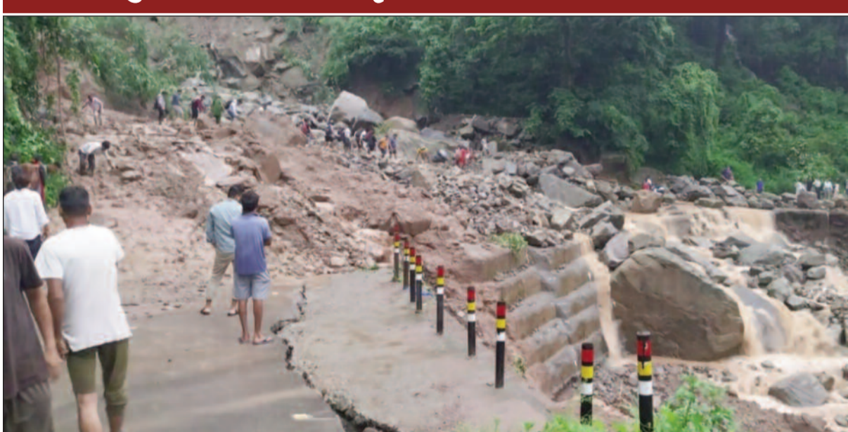
कोटद्वार-दुगड़ा के मध्य पांचवे मील से दो किलोमीटर आगे बरसाती रफटे में आया मलबा व बोल्टर

कोटद्वार-दुगड़ा के मध्य अतिवृष्टि से सात से अधिक स्थानों पर आया बोल्टर व मलबा