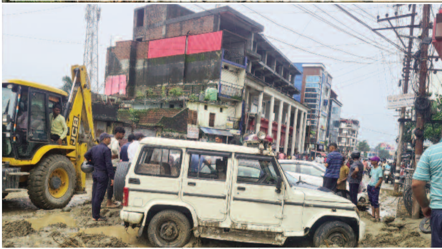
कोटद्वार के देवी रोड में भरा पनियाली गदरे का मलबा