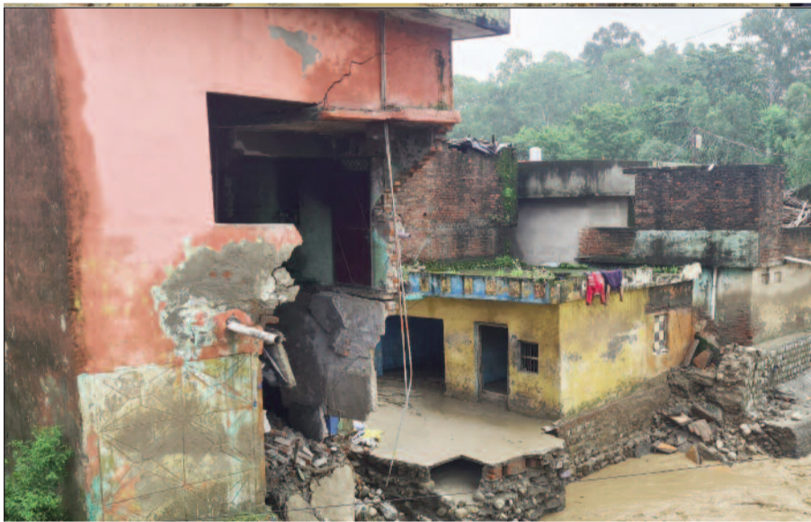
पनियाली गदरे के उफान से कौड़िया बस्ती में धराशायी हुआ भवन का हिस्सा

जयन्त प्रतिनिधि। कोटद्वार : मंगलवार दोपहर से बुधवार सुबह आठ बजे तक लगातार चली वर्षा नगर क्षेत्र में कहरबनकर टूटी। नदी-नाले उफान पर आने से जगह-जगह तबाही के मंजर दिखाई दिए। गिर्वस्रोत व पनियाली गदरे ने नगर क्षेत्र में सबसे अधिक तबाही मचाई।