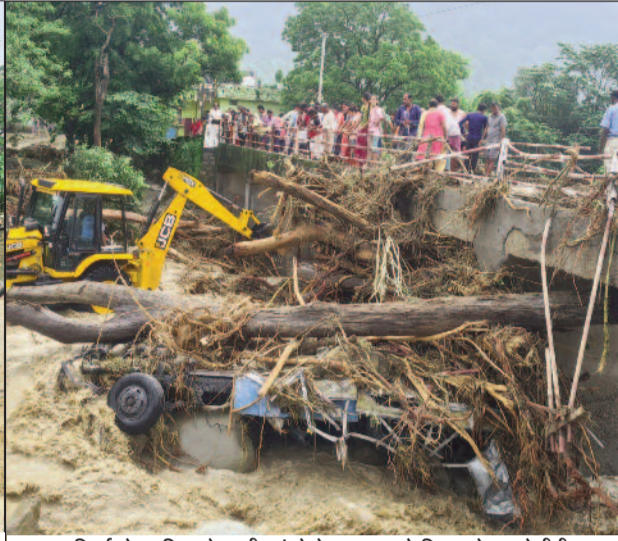
गिर्वस्रोत पुलिया के समीप फंसे पेड़ व बस को निकालते हुए जेसीबी