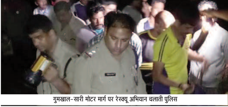
गुमखाल-सारी मोटर मार्ग पर रेस्क्यू अभियान चलाती पुलिस

जयन्त प्रतिनिधि। कोटद्वार : जयहरीखाल प्रखंड के गुमखाल-सारी मोटर मार्ग में एक आल्टो कार गहरी खाई में गिर गई। हादसे में चार लोगों की मौके पर ही मौत हो गई। एसडीआरएफ ने ग्रामीणों की मदद से शवों को खाई से बाहर निकाला।