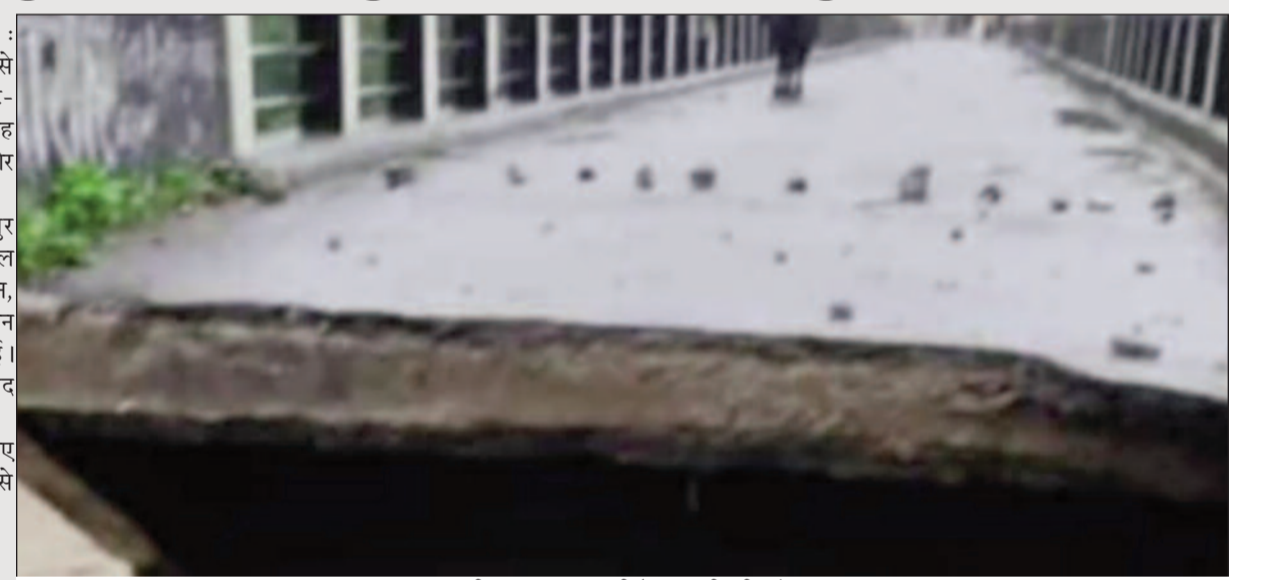
गाड़ीघाट-रतनपुर- कुंभीचौड़ पुल की ढही एप्रोच

अतिवृष्टि से जंगल का मलबा सड़क पर आ गया। जिससे सड़क पर आवागमन पूरी तरह