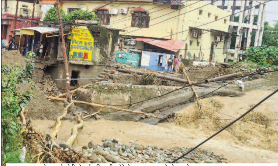
कोटद्वार के देवी रोड में पनियाली गदरे के उफान पर आने से पुल के आसपास हुआ भू-कटाव

गिर्वस्रोत व पनियाली गदरे से नगर में हुआ भारी नुकसान, पुलों के पिलर में पेड़ फंसने से दुकान व घरों में घुसा मलबा