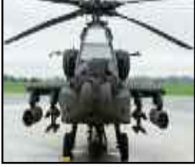
बोईंग ने शुरू किया प्रोडक्शन

नई दिल्ली, एजेन्सी। विमान बनाने वाली कंपनी बोईंग ने भारतीय सेना के लिए ई-मॉडल अपाचे हेलीकॉप्टर का उत्पादन शुरू करने की घोषणा की है। कंपनी ने जारी बयान में कहा कि बोईंग एरिजोना के मेसा स्थित संयंत्र में भारतीय सेना के अपाचे का उत्पादन शुरू कर रही है। कंपनी भारतीय सेना की जरूरतों को पूरा करते हुए कुल छह एएच-64ई अपाचे की आपूर्ति करेगी। इस साल इससे पहले, टाटा बोईंग एरोस्पेस लिमिटेड (टीबीएएल) ने हैदराबाद में स्थित अपनी आधुनिक फैक्ट्री से भारतीय सेना के पहले एएच-64 अपाचे ढांचे की आपूर्ति की थी।