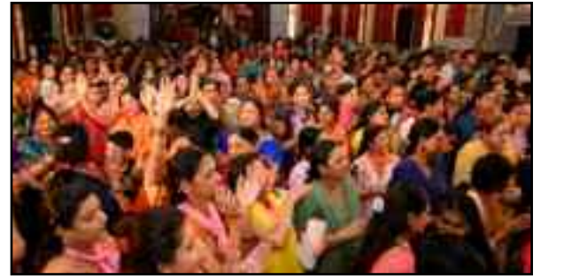
आयोजित कार्यक्रम में भाग लेते श्रद्धालु