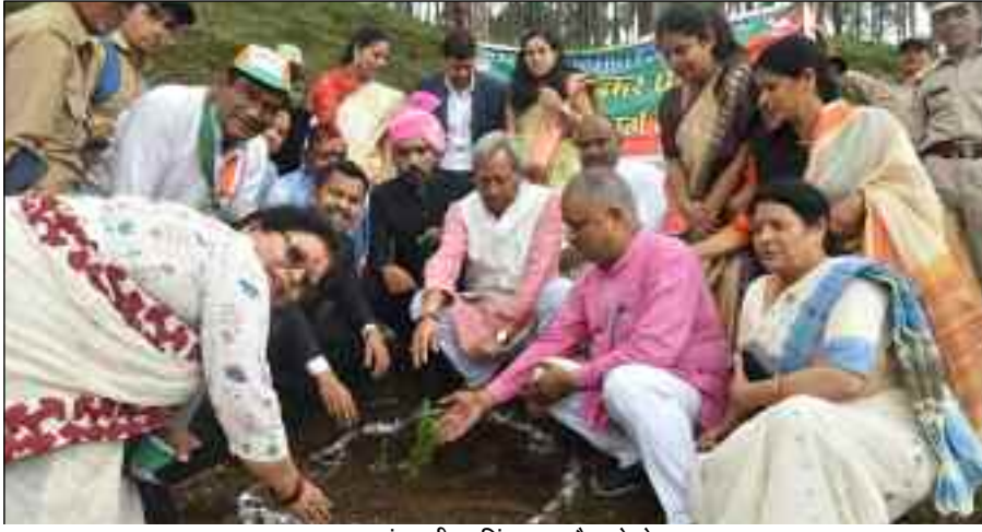
गढ़वाल सांसद तीर्थ सिंह रावत पौधा रोपते हुए।