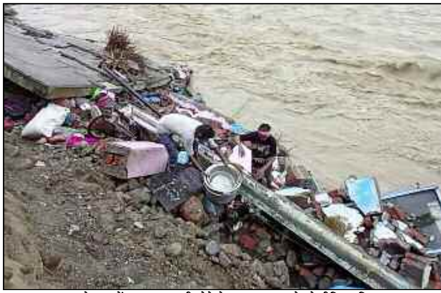
कोटद्वार में भवन धराशायी होने के बाद सामान खोजते पीड़ित परिवार

गाड़ीघाट, झूलापुल बस्ती व काशीरामपुर तल्ला में बाढ़ प्रभावित परिवार पिछले चार दिन से धर्मशाला, मंदिर व स्कूलों में रात काट रहे हैं। बेघर हुए इन परिवारों के समक्ष कई संकट खड़े होने लगे हैं। मकान बहने के बाद केवल तन पर पहने कपड़े ही बचे हुए हैं। पीड़ितों का आरोप है कि उनके पास छोटे बच्चे को दूध पिलाने तक के पैसे नहीं बचे हैं। लेकिन, सरकारी तंत्र ने राहत के नाम पर फूटी कौड़ी तक नहीं दी। ऐसे में उन्हें अपने व अपने बच्चे के भविष्य को लेकर चिंता सताने लगी है।