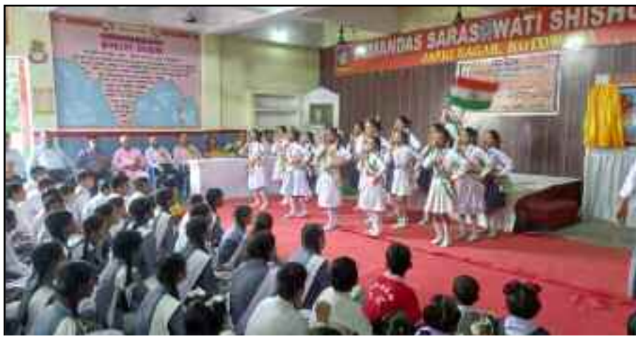
स्वतंत्रता दिवस पर सांस्कृतिक प्रस्तुति देते विद्यार्थी।