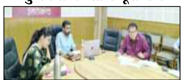
डीएम डॉ. आशीष चौहान बैठक में अधिकारियों को निर्देश देते हुए।

पौड़ी : जल जीवन मिशन की बैठक में डीएम ने जल संस्थान व जल निगम के अफसरों को गुणवत्ता के साथ कार्य समय पर पूरा करने के निर्देश दिए। कहा कि हर महीने दिए गए लक्ष्यों के सापेक्ष कार्यों में तेजी लाई जाए। बुधवार को एनआईसी कक्ष में बैठक लेते हुए जिलाधिकारी डा. आशीष चौहान ने सभी अफसरों को जल जीवन मिशन के तहत पूरे हो चुके कार्यों को पोर्टल पर भी अपलोड करने के निर्देश दिए। कहा कि जल जीवन मिशन के तहत जिस अफसर के