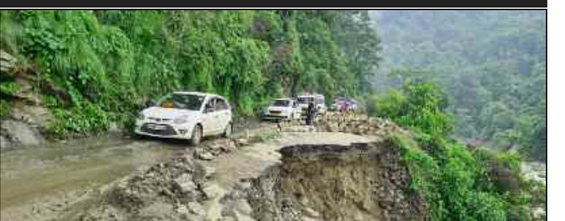
कोटद्वार-दुगड़ा के मध्य लोक निर्माण विभाग के गोदाम के समीप गायब हुआ हाईवे का हिस्सा

हिस्सा नदी की भेंट चढ़ गया। अन्य स्थानों पर तो सरकारी सिस्टम ने मलबा हटा दिया है। लेकिन, उक्त क्षतिग्रस्त हिस्से में केवल छोटे वाहनों की आवाजाही का रास्ता बचा हुआ है। सुरक्षा दृष्टि को देखते हुए सरकारी सिस्टम ने मार्ग पर भारी वाहनों की आवाजाही पर रोक लगाई हुई है। उक्त स्थान से मैक्स वाहन के गुजरने से पहले एक छोर पर सवारियों को नीचे उतारा जा रहा है। क्षतिग्रस्त हिस्से की मरम्मत के लिए मौके पर पथर व लोहे के जार एकत्रित कर लिए गए हैं। ऐसे में अभी भारी वाहनों को पहाड़ चढ़ने के लिए काफी लंबा इंतजार करना पड़ सकता है।