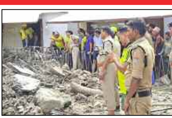
मोटर चट्टी के पास जोगियाना में रेस्क्यू करते हुए टीम।

गत सोमवार को हुई मूसलाधार बारिश के कारण जनपद के थाना लक्ष्मणझुला क्षेत्रान्तर्गत मोहन चट्टी के पास जोगियाना में स्थित नाईट पेरेडाइज कैम्प भूस्खलन की