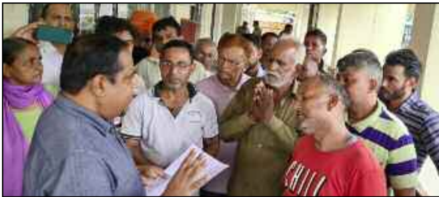
कोटद्वार तहसील में उपजिलाधिकारी को ज्ञापन देते आपदा पीड़ित