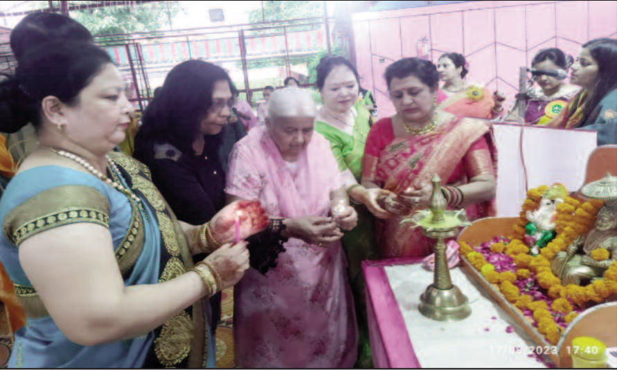
तीज कार्यक्रम का शुभारंभ करती मुख्य अतिथि