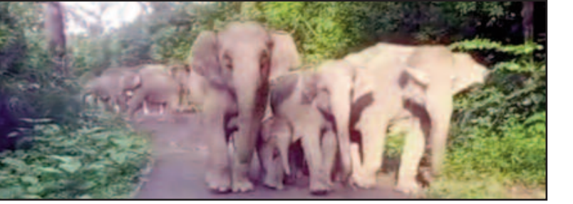
कोटद्वार- पुलिंडा मार्ग पर धमका हाथियों का झुंड

कोटद्वार : लैंसडौन वन प्रभाग क्षेत्र के अंतर्गत कोटद्वार-पुलिंडा मार्ग पर हाथियों की धमक थमने का नाम नहीं ले रही। शुक्रवार को हाथियों का एक झुंड जंगल से निकलकर मार्ग पर पहुंच गया। करीब एक घंटे तक हाथियों का यह झुंड मार्ग पर टहलता रहा। जिसके कारण मार्ग के दोनों ओर वाहनों का लंबा जाम लगा रहा। मौके पर पहुंची वन विभाग की टीम ने पटाखे व हवाई फायर कर हाथियों को जंगल में खदेड़ा। शुक्रवार सुबह अचानक हाथियों का झुंड मार्ग पर धमक गया। ऐसे में मार्ग से आवाजाही कर रहे लोगों में आफरा-तफरी मच गई। वाहन चालकों ने हाथी से बचाव के लिए कई मीटर दूर अपने वाहन खड़े कर दिये। घंटों लोग हाथियों के जंगल में वापस