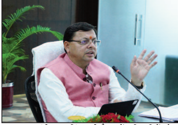
मुख्यमंत्री पुष्कर सिंह धामी बैठक में अधिकारियों को निर्देश देते हुए।

पोषित योजनाओं एवं बाह्य सहायित परियोजनाओं की समीक्षा बैठक के दौरान अधिकारियों को दिये। मुख्यमंत्री ने निर्देश दिये कि विभिन्न विकास योजनाओं के तहत केंद्र सरकार से धनराशि स्वीकृत होने के बाद फाइल अनावश्यक रूप से शासन में लंबित न रहे। विभागीय सचिव अपने स्तर से स्वीकृत धनराशि जारी करें। मुख्यमंत्री ने कहा कि केंद्र पोषित योजनाओं का राज्य को पूरा फायदा मिल सके, इसके लिए सभी विभाग समन्वय के साथ कार्य करें। सभी विभाग योजनाओं के सफल क्रियान्वयन की दिशा में अपनी ओर से बेस्ट