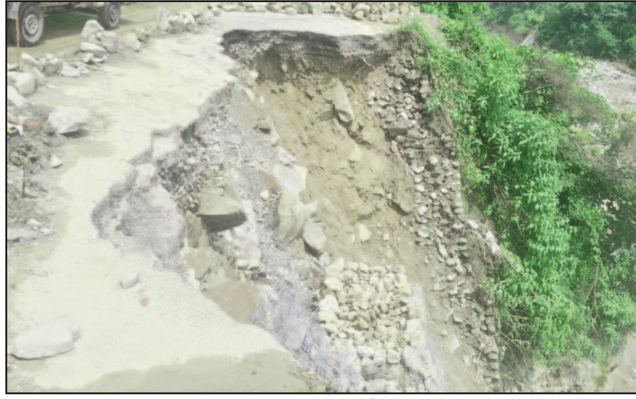
कोटद्वार-दुगड्डा के मध्य लालपुल से करीब पांच सौ मीटर पहले पुश्ते की मरम्मत करवाता एनएच विभाग।

13 अगस्त की रात हुई अतिवृष्टि से लालपुल से करीब पांच सौ मीटर पहले ढह गया था पुश्ता पिछले छह दिन से कोटद्वार-दुगड्डा मार्ग पर बंद पड़ी है भारी वाहनों की आवाजाही