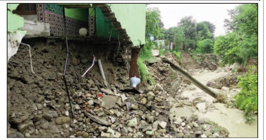
कोटद्वार में 13 अगस्त की रात अतिवृष्टि से धराशायी हुआ भवन का हिस्सा

बच्चों के भविष्य की भी चिंता खोह नदी व बेहडास्रोत के तेज बहाव में बेघर हुए परिवारों के समक्ष अपने बच्चों के भविष्य को लेकर भी चिंता सताने लगी है। पाई-पाई जोड़कर खड़े किए भवन के साथ नदी बच्चों की किताब, कापी व अन्य शैक्षिक सामग्री बहाकर ले गई है। ऐसे में अभिभावकों की चिंता और अधिक बढ़ने लगी है। वहीं, स्नातक की पढ़ाई पूरी कर नौकरी की तलाश में जुटे युवाओं के शैक्षणिक दस्तावेज भी नदी में बह चुके हैं।