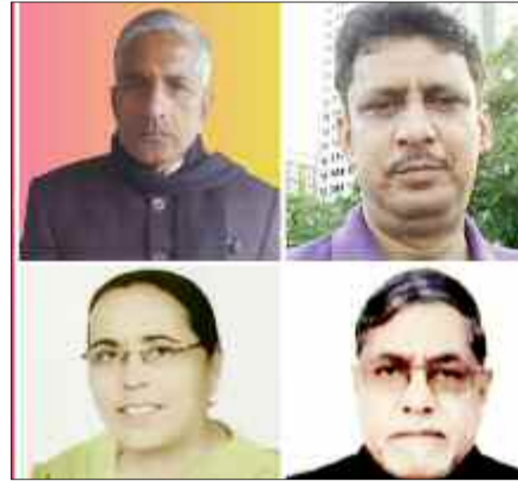
के गठन से पूर्व में लंबित पत्रकारों के पेंशन, मेडिकल, मृतक