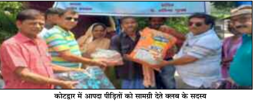
कोटद्वार में आपदा पीड़ितों को सामग्री देते क्लब के सदस्य