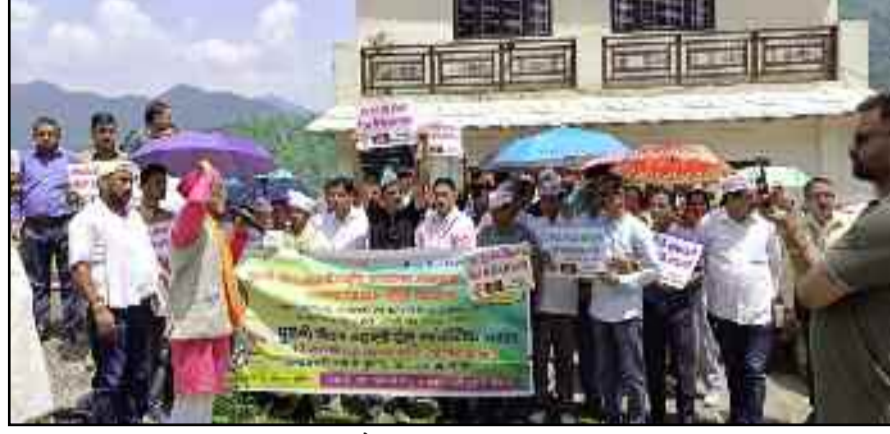
सतपुली में आक्रोश रैली निकालते शिक्षक व सरकारी कर्मचारी

गढ़वाल सांसद तीर्थ सिंह रावत के घर पर घंटी बजाई। इस दौरान कर्मचारी व अधिकारियों ने सतपुली बाजार में आक्रोश रैली भी निकाली। कहा कि सरकारी कर्मचारी व अधिकारियों की अनदेखी किसी भी हाल में बर्दाश्त नहीं की जाएगी। यदि जल्द समस्या का निराकरण नहीं हुआ तो आंदोलन को तेज किया जाएगा। पुरानी पेंशन बहाली को