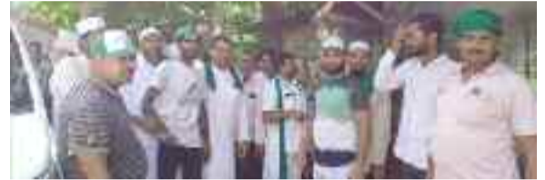
कोटद्वार चेक पोस्ट में परिवहन विभाग के खिलाफ प्रदर्शन करते किसान यूनियन के सदस्य व पदाधिकारी

कहा कि इस संबंध में जल्द ही किसान यूनियन के पदाधिकारी देहरादून में मुख्यमंत्री पुष्कर सिंह धामी से भी मुलाकात करेंगे। यदि मनमानी पर विराम नहीं लगा तो किसान यूनियन कौड़िया चेक पोस्ट पर ही डेरा डालकर आंदोलन करेगा।