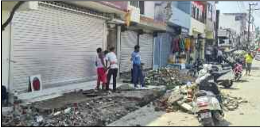
कोटद्वार के बदरीनाथ मार्ग में श्रमिकों की मदद से अतिक्रमण को तुड़वाते व्यापारी

उच्च न्यायालय के निर्देश पर शनिवार को शहर में चलाया गया था अतिक्रमण हटाओ अभियान