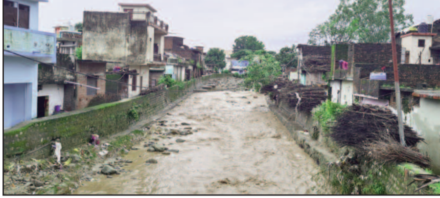
कौड़िया बस्ती के समीप बहने वाला पनियाली गंदरा, जिससे बस्ती में तबाही मचाई थी।

♦कौड़िया बस्ती के अधिकांश घरों के बाहर अब भी भरा है मलबा ♦दुर्गंध के कारण बस्तीवासियों को सप्ताह संक्रामक बीमारियों का खतरा