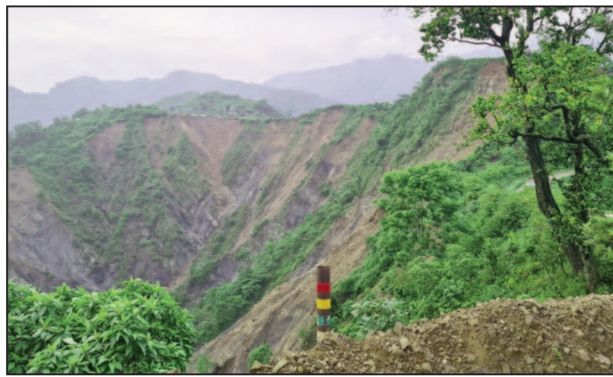
दुग्गा ब्लाक के अंतर्गत ग्राम पुलंडा के समीप पहाड़ी पर हो रहा भूस्खलन।

दुग्गा ब्लाक के घाड़ क्षेत्र के अंतर्गत पुलंडा गांव में वर्ष 1978 से लगातार भूस्खलन हो रहा है। स्थिति यह है कि गांव में हो रहे भूस्खलन से कई घरों में दरारें पड़ चुकी हैं। लेकिन, अगस्त माह में हुई वर्षा के बाद यह दरारें और अधिक गहरी होने लगी हैं। ऐसे में गांव के अस्तित्व पर लगातार खतरा मंडरा रहा है। ग्रामीणों ने बताया कि 24 अगस्त, 2015 के शासनदेश में जनपद में स्थित संवेदनशील गांवों को तीन श्रेणियों में बांटकर चरणबद्ध तरीके से ग्रामीणों के पुनर्वास के प्रस्ताव शासन को भेजने के