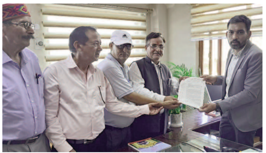
जिलाधिकारी को ज्ञापन देते प्रतिनिधि मंडल के सदस्य

गढ़वाल सांसद तीर्थ सिंह रावत ने आमसौड़ सहित अन्य क्षेत्रों का दौरा किया। सांसद ने बताया कि अतिवृष्टि के कारण क्षेत्र को काफी नुकसान हुआ है। ऐसे में केंद्र व प्रदेश सरकार ग्रामीणों की मदद के लिए पूरी गंभीरता से कार्य कर रही है। निरीक्षण के दौरान ग्रामीणों ने सांसद को ज्ञापन भी दिया।