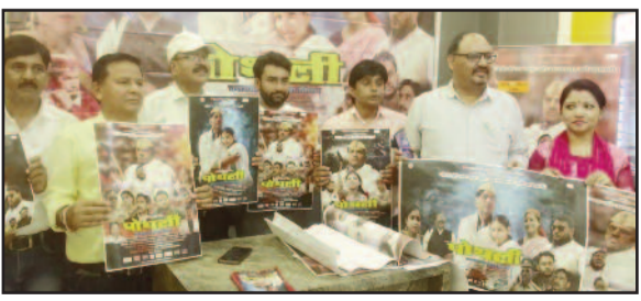
पत्रकार वार्ता में फिल्म के बारे में जानकारी देते सदस्य