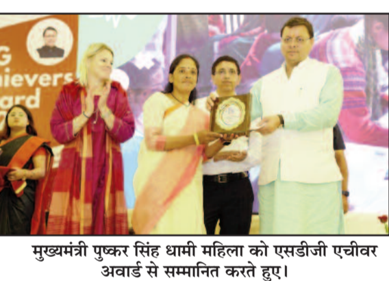
मुख्यमंत्री पुष्कर सिंह धामी महिला को एसडीजी एचीवर अवार्ड से सम्मानित करते हुए। उन्होंने जरूरत बताई। इस अवसर पर मुख्यमंत्री ने घोषणा की कि वर्ष 2030 तक सतत विकास लक्ष्यों को पूर्ण करने के लिए जनपदों में प्रतियोगिता की भावना के दृष्टिकोण से वर्ष 2030 तक 17 सितंबर से 23 सितंबर तक एफ.डी.जी.सप्ताह के रूप में मनाया जायेगा। जिसमें सभी विकासखण्डों, पंचायतों विद्यालयों, जनपदों एवं राज्य स्तर पर कार्यशालाएं, जन जागरूकता कार्यक्रम, वाद-विवाद प्रतियोगिता आयोजित की जायेगी। मुख्यमंत्री ने सम्मानित होने वाले व्यक्तियों और संस्थाओं को बधाई देते हुए उम्मीद जताई कि इससे अन्य लोग और संस्थाएं भी प्रेरित होंगे। उन्होंने कहा कि समाज और देश के लिये काम करने वाले व्यक्तियों से मिलकर वे स्वयं प्रेरित होते हैं। उन्होंने कहा कि सतत विकास वह विकास है जो भविष्य की पीढ़ियों की अपनी जरूरतों को पूरा करने की क्षमता से समझौता किए बिना वर्तमान की जरूरतों को पूरा करता है। उत्तराखण्ड सरकार भी सतत

जयन्त प्रतिनिधि देहरादून : मुख्यमंत्री पुष्कर सिंह धामी ने बुधवार को सुभाष रोड स्थित होटल में आयोजित कार्यक्रम में 17 व्यक्तियों और संस्थाओं को एसडीजी एचीवर अवार्ड से सम्मानित किया। जिसमें 12 संस्थाओं एवं 05 लोगों को व्यक्तिगत रूप से सम्मानित किया गया। मुख्यमंत्री ने कहा कि विकास के लक्ष्य को हासिल करने के लिये सभी को सम्मिलित रूप से प्रयास करने होंगे। आत्मनिर्भर उत्तराखण्ड बनाने के लिए सबको समन्वित प्रयास करने होंगे। बहुत सी संस्थाएं और व्यक्ति सामाजिक, आर्थिक व पर्यावरण के क्षेत्र में बेहतर काम कर रहे हैं। ये सभी राज्य के विकास के ब्राण्ड एम्बेसेडर हैं। उत्तराखण्ड को श्रेष्ठ राज्य बनाने के लिये हम सभी को मिलकर आगे बढ़ना है। इकोलॉजी और इकोनॉमी में संतुलन बनाकर विकास जरूरी है। राज्य में सतत विकास लक्ष्य में बेहतर कार्य हो रहे हैं। एसडीजी इंडेक्स में उत्तराखण्ड को अग्रणी राज्यों की श्रेणी में लाने के लिए और प्रयासों की भी