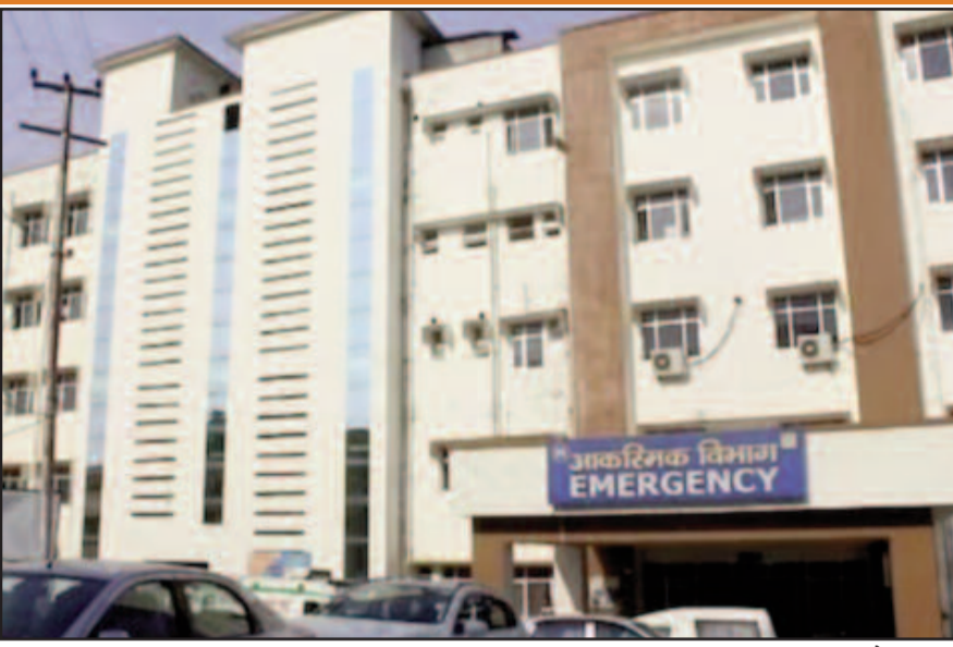
कोटद्वार का राजकीय बेस चिकित्सालय जहां इन दिनों डेंगू के मामले बढ़ रहे हैं

अपने आसपास कहीं भी पानी जमा न होने दें। कोटद्वार बेस अस्पताल के साथ ही