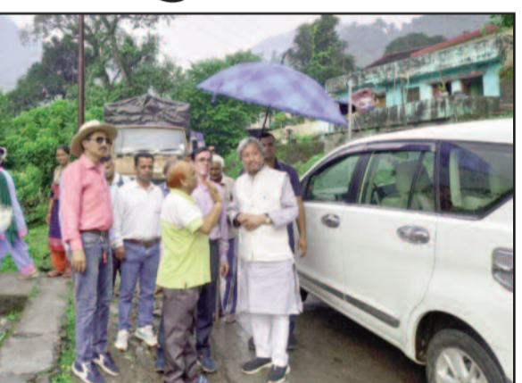
दुर्गापुर ब्लॉक में आपदा प्रभावित क्षेत्रों का दौरा करते गढ़वाल सांसद