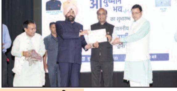
"आयुष्मान भव" अभियान के शुभारंभ के अवसर पर राजभवन में हुए राज्यस्तरीय कार्यक्रम आयोजित

देहरादून। राष्ट्रपति द्रौपदी मुर्मू ने बुधवार को गांधीनगर, गुजरात से "आयुष्मान भव" अभियान का वर्चुअली शुभारंभ किया। आयुष्मान भव अभियान केंद्रीय स्वास्थ्य और परिवार कल्याण मंत्रालय की एक व्यापक राष्ट्रव्यापी स्वास्थ्य सेवा पहल है जिसका उद्देश्य देश के हर गांव और कस्बे तक स्वास्थ्य सेवाओं की संतुष्टि कब्रज प्रदान करना है। यह अभियान 17 सितंबर से 2 अक्टूबर 2023 तक "सेवा पखवाड़ा" के दौरान चलाया जाएगा। आयुष्मान भव अभियान के अंतर्गत आयुष्मान-आपके द्वार 3.0, स्वास्थ्य केंद्रों व सामुदायिक स्वास्थ्य केंद्रों में आयुष्मान सभाओं का आयोजन और हर गांव व पंचायत में आयुष्मान मेलों के माध्यम से स्वास्थ्य सेवाओं के कवरेज को अधिक से अधिक करना है। उद्घाटन समारोह में केंद्रीय स्वास्थ्य और परिवार कल्याण मंत्री डॉ. मनसुख मांडवीया,