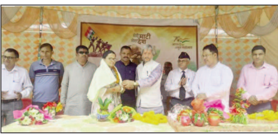
कोटद्वार में आयोजित कार्यक्रम के दौरान सैनिक परिवारों को सम्मानित करते गढ़वाल सांसद