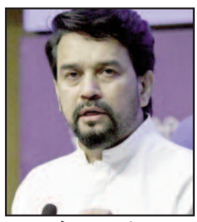
कई केंद्र प्रायोजित योजनाएं केंद्र सरकार के न्याय विभाग, उच्चतम न्यायालय की ई-कमेटी की संयुक्त साझेदारी के तहत संबंधित राज्यों के उच्च न्यायालयों के माध्यम से विकेन्द्रीकृत तरीके से कार्यान्वित की जाएगी। इसके लिए त्रिपक्षीय समझौते किए जाएंगे। ऐसी प्रणाली जो सभी हितधारकों के लिए प्रणाली के अधिक सुलभ, किफायती, विश्वसनीय, पूर्वानुमानित और पारदर्शी बनाकर न्याय में आसानी को बढ़ावा देगी। अनुसूचक ठाकुर ने कहा कि ई-कोर्ट परियोजना का तीसरा चरण "पहुंच और समावेशन" के दर्शन पर आधारित है। इसके अंतर्गत पहले और दूसरे चरण के लाभों को और आगे बढ़ाते हुए न्यायालयों के संपूर्ण रिकॉर्ड के डिजिटलीकरण के माध्यम से बिजली पर आधारित जर्नी की बैंक-अप जैसी सुविधाएं भी की जाएगी। सूचना प्रसारण मंत्री ने बताया कि ई-कोर्ट चरण तीन