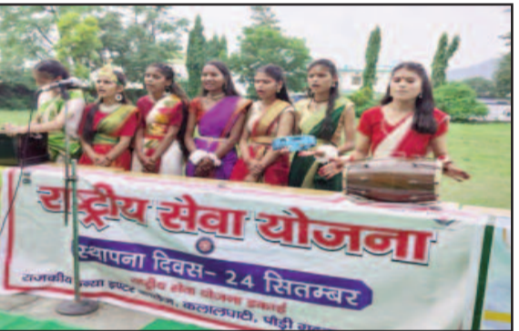
एनएसएस के स्थापना दिवस पर प्रस्तुति देती छात्राएं