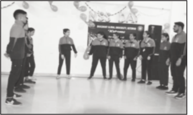
एनएसएस शिविर में प्रतिभाग करते विद्यार्थी