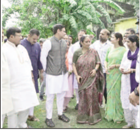
कोटद्वार के पशु चिकित्सालय का निरीक्षण करते काबीना मंत्री सौरभ बहुगुणा

जयन्त प्रतिनिधि। कोटद्वार: पशुपालन मंत्री सौरभ बहुगुणा ने कहा कि प्रदेश सरकार निराश्रित गौवंशों के संरक्षण को लेकर गंभीरता से कार्य कर रही है। जिलाधिकारी को कहीं भी सरकारी भूमि को गौशाला के रूप में उपयोग करने की पावर दी गई है। जल्द ही सड़कों पर घूम रहे गौवंशों को गौशाला में शिफ्ट कर दिया जाएगा। कहा कि उत्तराखंड पहला राज्य है जहां निराश्रित गौवंश के लिए कैबिनेट में योजना तैयार की है। गौवंशों के संरक्षण के लिए 82 करोड़ रुपये का प्रावधान प्रति वर्ष पास किया गया है।