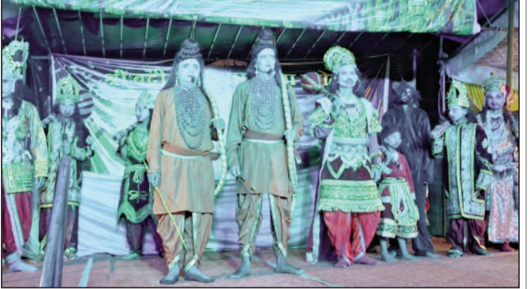
कोटद्वार के बेलाडट में आयोजित रामलीला में मंचन करते कलाकार।