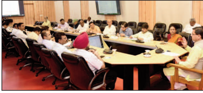
मुख्यमंत्री पुष्कर सिंह धामी समीक्षा बैठक में अधिकारियों को निर्देश देते हुए।

देहरादून : मुख्यमंत्री पुष्कर सिंह धामी ने गुरुवार को मुख्यमंत्री आवास में ग्लोबल इन्वेस्टर्स समिट के लिए निवेश के लिए विभागों द्वारा जिन परियोजनाओं पर कार्य किया जा रहा है उनकी समीक्षा की। मुख्यमंत्री ने कहा कि राज्य के पर्वतीय क्षेत्रों में निवेश बढ़ाने के लिए और प्रभावी प्रयासों की जरूरत है। राज्य का समग्र विकास पर्वतीय क्षेत्रों के विकास से ही संभव है। पर्वतीय क्षेत्रों में निवेशकों को निवेश करने के लिए लगातार प्रोत्साहित किया जाए। उन्होंने कहा कि राज्य में निवेश के लिए अनेक संभावनाएं हैं, इन संभावनाओं को हमें कार्यरूप में लाकर प्रदेश की आर्थिकी को तेजी से बढ़ाना है। मुख्यमंत्री ने बैठक में अधिकारियों को निर्देश दिये कि राज्य में निवेश को तेजी से बढ़ाने के लिए विभागों में बनी पॉलिसी को और बेहतर बनाने