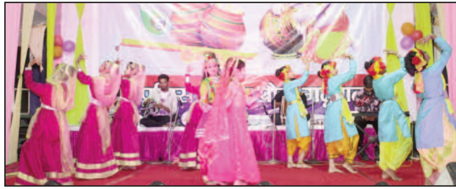
श्रीकृष्ण जन्माष्टमी पर्व पर सांस्कृतिक कार्यक्रम की प्रस्तुति देते हुए बच्चों।