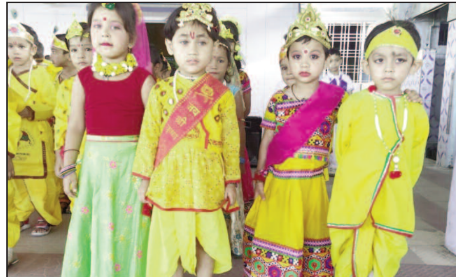
राधा-कृष्ण की वेशभूषा में सजे हुए स्कूली बच्चों।