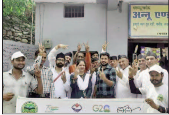
सतपुली में सफाई के प्रति जागरूक करते कलाकार।

सतपुली : नगर पंचायत में सफाई एवं स्वच्छता के लिए दिव्यांग कल्याण समिति, बिलखेत द्वारा सतपुली नगर में नुकड़ नाटक के जरिए जन जागरण अभियान चलाया गया। नगर के विभिन्न हिस्सों में संस्था के कलाकारों द्वारा नुकड़ नाटक के जरिए सार्वजनिक स्थलों पर कूड़ा करकट न फेंकने, गीले और सूखे कचरे हेतु अलग-अलग डिब्बे उपयोग करने की, नगर पंचायत के वाहन में ही कूड़ा डालने, अपने अगल बगल