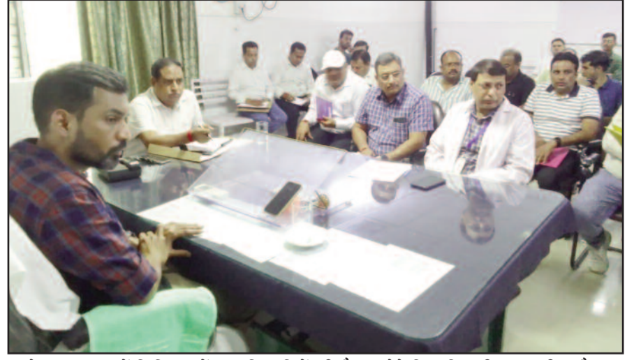
बेस अस्पताल में चिकित्सकों व अधिकारियों की बैठक लेते जिलाधिकारी डा.आशीष चौहान

में डेंगू के 111 मामले सामने आए। उन्होंने बैठक के दौरान आशा सुपरवाइजर के माध्यम से क्षेत्र में कार्य कर रही आशा कार्यकर्ताओं से फोन पर वार्ता कर उनकी उपस्थिति व सक्रियता की जानकारी ली। आशा कार्यकर्ताओं की ओर से दी गई सर्वे रिपोर्ट व स्वास्थ्य विभाग की रिपोर्ट में विभिन्नता पाए जाने पर जिलाधिकारी ने तीन दिन के भीतर सही रिपोर्ट प्रस्तुत करने के निर्देश दिए। उन्होंने नगर निगम के अधिकारियों को नगर क्षेत्र अंतर्गत वार्ड संख्या तीन, किशनपुरी, लकड़ीपड़ाव, शिबूनगर वार्ड-8 और रेलवे स्टेशन के आसपास नियमित रूप से फोगिंग और एंटी लार्वा स्प्रे का छिड़काव करवाने के निर्देश