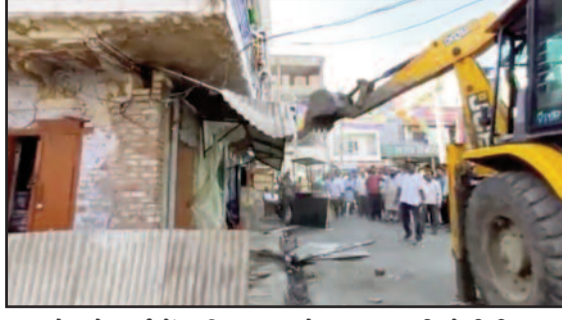
गोखले मार्ग में अतिक्रमण को ध्वस्त करती जेसीबी

निगम व प्रशासन ने पुलिस के साथ मिलकर शहर में तीस से अधिक अतिक्रमण चिह्नित किए थे। इसके लिए बाकायदा इंचार्ज से कोतवाली के मध्य निगम की नजूल भूमि पर बने बरामदों को खाली करवाया गया था। एक दिन अतिक्रमण के खिलाफ कार्रवाई करने के बाद नगर निगम व प्रशासन गहरी नींद में सो गया था। कुछ दिन पूर्व दैनिक जयन्त में नगर निगम व प्रशासन की इस लापरवाही को लेकर खबर प्रकाशित की गई थी। जिसके बाद शनिवार को नगर निगम ने गोखले मार्ग के अतिक्रमणकारियों को 48 घंटे के भीतर स्वयं ही अतिक्रमण हटाने की चेतावनी दी। अभियान के तहत बुधवार