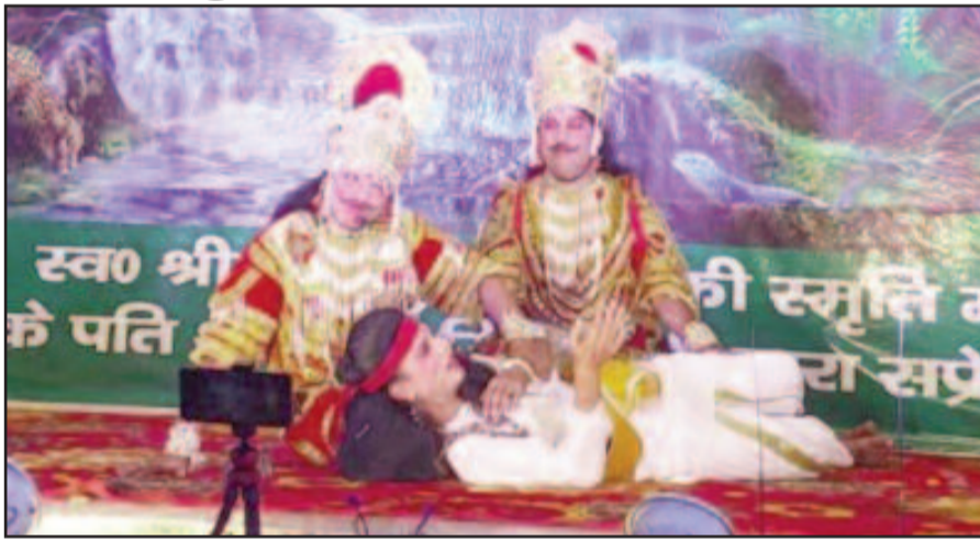
कोटद्वार में आयोजित रामलीला में मंचन करते कलाकार

बाल रामलीला कमेटी की ओर से आयोजित की गई रामलीला