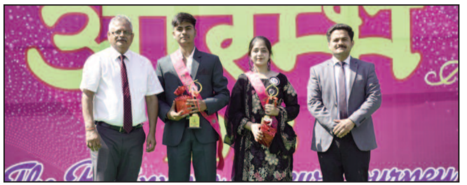
आयोजित कार्यक्रम में प्रतिभाग करते विद्यार्थी