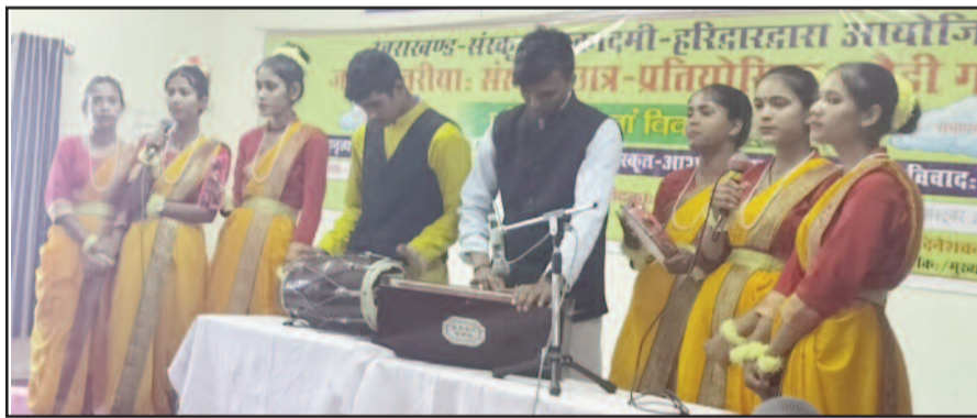
कोटद्वार में आयोजित प्रतियोगिताओं में प्रतिभाग करते विद्यार्थी

कहा कि इससे विद्यार्थियों को जीवन में आगे बढ़ने में मदद मिलती है। इस दौरान सामूहिक नाटक में राजकीय इंटर कालेज संदीखाल, राजकीय इंटर कालेज पीपली, राजकीय इंटर कालेज उर्फखाल, वाद-विवाद में डीएवी