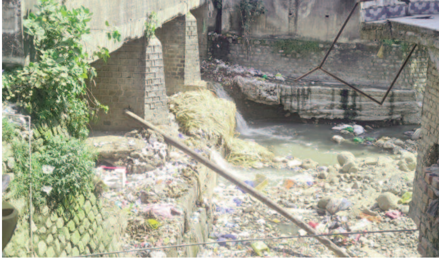
कोटद्वार देवी रोड में पनियाली गदरे में लगे गंदगी के ढेर

पर लगाम नहीं लगा पा रहा है। गंदगी से उठ रही दुर्गंध के कारण आमजन का सांस लेना भी दूधर हो गया है। घाड़ क्षेत्र के जंगल से निकलने वाला पनियाली गदरे तीन किलोमीटर के हिस्से में नगर से होकर गुजरता है।