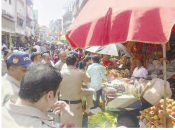
कोटद्वार के गोखले मार्ग पर अतिक्रमण के खिलाफ कार्रवाई करती पुलिस