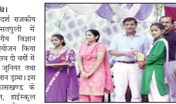
बाल वैज्ञानिक को सम्मानित करते हुए मुख्य अतिथि।