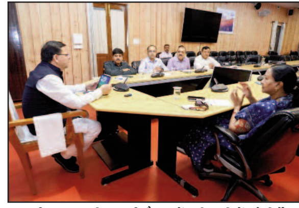
सीएम पुष्कर सिंह धामी बैठक में अधिकारियों को निर्देश देते हुए।

जयन्त प्रतिनिधि देहरादून : मुख्यमंत्री पुष्कर सिंह धामी ने प्रधानमंत्री नरेन्द्र मोदी द्वारा पिथौरागढ़ जिले के भ्रमण के दौरान दिए गए विजन को साकार करने के लिए शासन के उच्चाधिकारियों को निर्देश दिये। शनिवार को मुख्यमंत्री आवास में अधिकारियों की बैठक में मुख्यमंत्री ने अधिकारियों को सीमावर्ती क्षेत्रों में चलाए जा रहे विकास कार्यों को प्राथमिकता के आधार पर पूर्ण करने के निर्देश दिए। राज्य एवं केंद्र सरकार द्वारा सीमान्त क्षेत्रों के विकास के लिये संचालित योजनाओं के प्रभावी