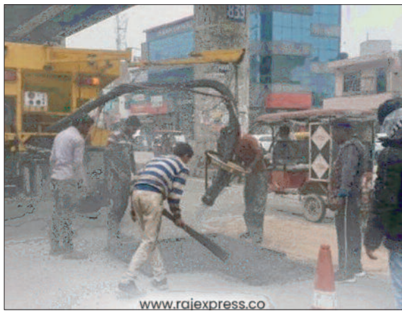
वाटर स्प्रेकलर मशीन से पानी का छिड़काव किया गया।