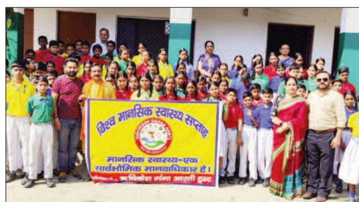
भेदभाव, उपलब्ध स्वास्थ्य सुविधाएं, मानसिक रोगियों के लिए

समाज व संस्कृति की भूमिका आदि विषयों पर जानकारी दी।