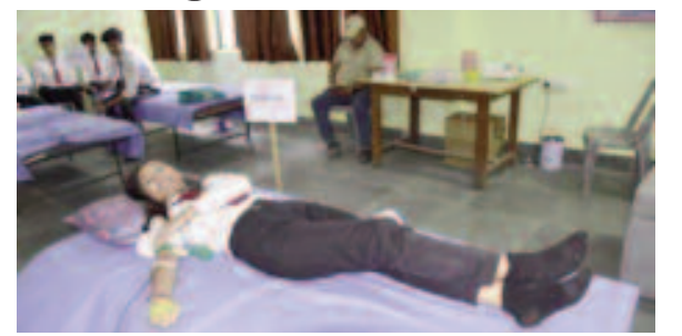
आयोजित शिविर में रक्तदान करती छात्रा