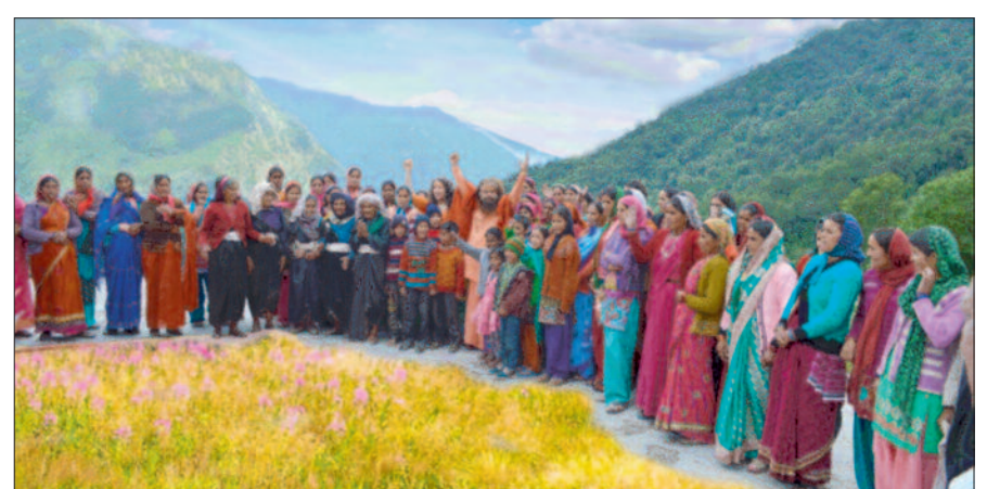
विधिविधान, अनुष्ठान आदि श्रेष्ठ कार्य के समय महिला को पुरुष के दहिनी ओर बैठाने की परंपरा को पीछे भी महिलाओं को श्रेष्ठ कार्यों में प्रार्थमिकता देने का चिंतन निहित

ऋषिकेश। परमार्थ निकेतन के अध्यक्ष स्वामी चिदानन्द सरस्वती जी ने गंगोत्री यात्रा के दौरान आज उत्तरकाशी में पहाड़ी महिलाओं से भेंट कर उनका हालचाल जाना तथा युवा पीढ़ी का पहाड़ से हो रहे पलायन के विषय में चर्चा की। उन्होंने कहा कि राष्ट्र के विकास में ग्रामीण व पहाड़ी महिलाओं का महत्वपूर्ण योगदान है। स्वामी चिदानन्द सरस्वती जी ने कहा कि भारतीय संस्कृति में नारी की महत्ता अद्भुत है। भारतीय संस्कृति में भगवान शिव का नाम अर्द्धनारीश्वर है। हमारा पौराणिक इतिहास व समग्र समाज महिलाओं की पुरस्कों के साथ बराबरी की भागीदारी की मान्यता, भावना एवं सिद्धांतों को मान्यता प्रदान करता है। पूजा,