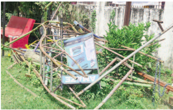
नगर निगम की ओर से मालवीय उद्यान पार्क के प्रवेश द्वार में रखा गया कबाड़

जयन्त प्रतिनिधि। कोटद्वार : जिस मालवीय उद्यान के सौदर्यीकरण के लिए नगर निगम ने लाखों रुपये खर्च किए अब नगर निगम उन्वकी सूरत बिगाड़ रहा है। हालत यह है कि पार्क के प्रवेश द्वार के समीप लोहे का कबाड़ एकत्रित किया गया है। ऐसे में लगातार पार्क की सूरत बिगड़ती जा रही है। जबकि, नगर निगम ने कुछ माह पूर्व लाखों की लागत से पार्क का सौदर्यीकरण करवाया था।