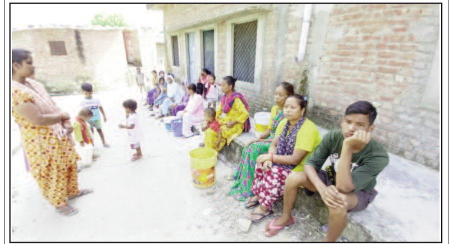
कोटद्वार के गिवईस्रोत मोहल्ले में पानी की तलाश में भटकते वार्डवासी

लोगों की लाख शिकायत के बाद भी गंभीरता नहीं दिखा रहा जल संस्थान