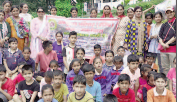
आयोजित प्रतियोगिता में प्रतिभाग करते खिलाड़ी