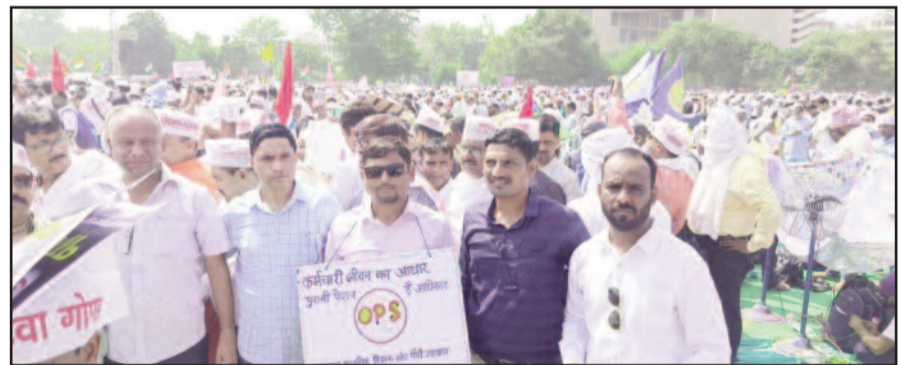
दिल्ली में प्रदर्शन करते शिक्षक संघ के सदस्य

जयन्त प्रतिनिधि। कोटद्वार: पुरानी पेंशन बहाली को लेकर माध्यमिक शिक्षक संघ पौड़ी के शिक्षकों ने दिल्ली रामलीला मैदान में प्रदर्शन किया। शिक्षकों ने जल्द पुरानी पेंशन बहाली नहीं होने पर आंदोलन को तेज करने की चेतावनी दी है।