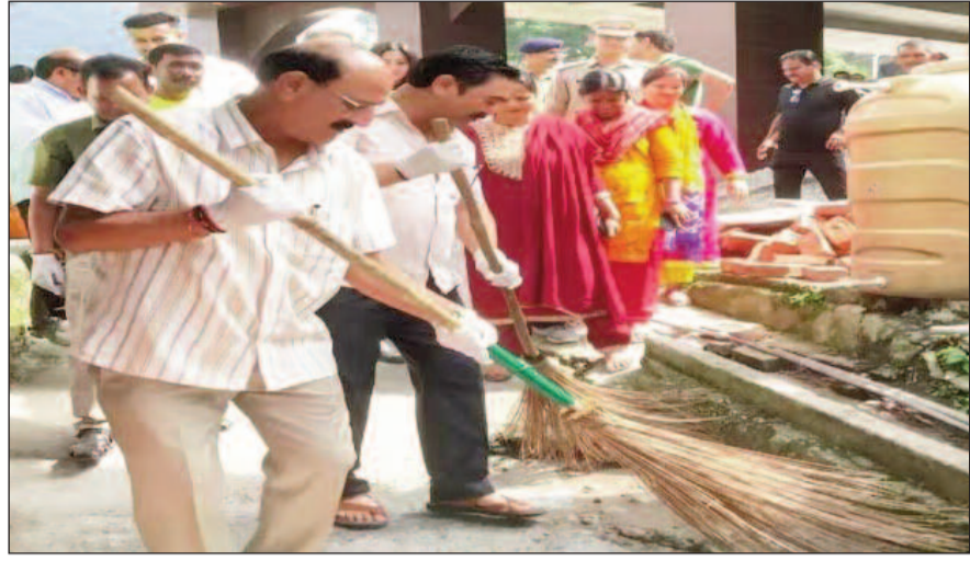
नई टिहरी। स्वच्छता ही सेवा कार्यक्रम के टिहरी जिले के विभिन्न कस्बों में विभिन्न संगठनों से जुड़े लोगों ने स्वच्छता अभियान चलाया। साथ ही लोगों को स्वच्छता के प्रति जागरूक भी किया गया। रविवार को स्वच्छता ही सेवा पखवाड़े के तहत चार को दिल्ली कूच करेगी आंगनबाड़ी कार्यकर्ता