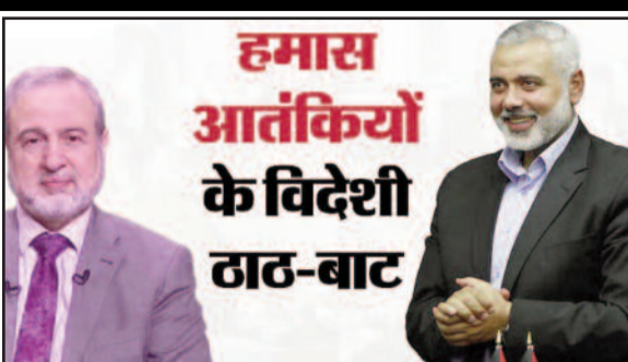
हमामस आतंकियों के विदेशी ठाठ-बाट