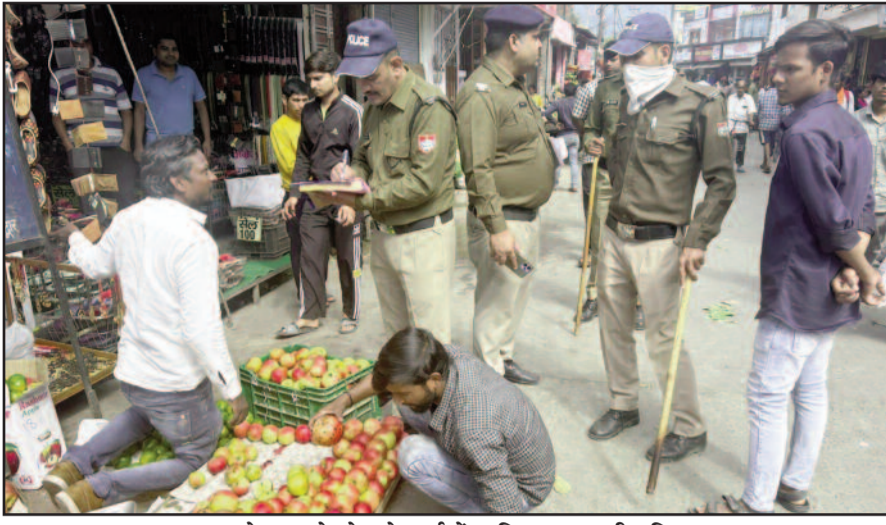
कोटद्वार के गोखले मार्ग में अभियान चलाती पुलिस

सोमवार को पुलिस की ओर से गोखले मार्ग में अतिक्रमण हटाओ अभियान चलाया गया। अभियान के दौरान जैसे ही पुलिस मार्ग में पहुंची अतिक्रमणकारियों में अफरा-तफरी मच गई। रेहड़ी-टेली व फड़ वाले अपना सामान लेकर गलियों में दौड़ने लगे। इस दौरान पुलिस ने नाली के बाहर सड़क पर दुकान सजने वाले 16 अतिक्रमणकारियों के चालान काटे। अभियान के दौरान गोखले मार्ग पूरी तरह साफ हो गया था। लेकिन, पुलिस के वापस थाने लौटते ही स्थिति दोबारा बिगड़ गई। सड़क पर सजी दुकानों के कारण आमजन का