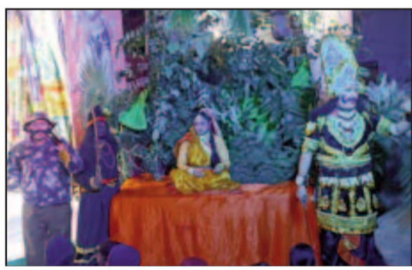
दुग्गुा में आयोजित रामलीला में मंचन करते कलाकार

लीला का आरंभ भगवान शंकर की झांकी और भजनों से किया गया। तत्वज्ञात लीला में अशोक वाटिका में रावण-सीता संवाद से हनुमान का अशोक वाटिका में प्रवेश व माता सीता की कुशल क्षेम पूछना, हनुमान को सीता माता की अनुमति पर वाटिका में फल खाना व वाटिका को उजाड़ना, रावण तक यह खबर पहुंचना, रावण का अक्षय कुमार को भेजना,