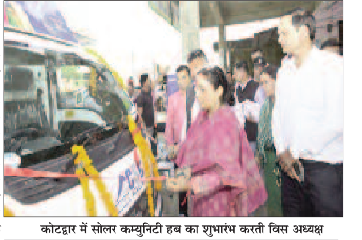
कोटद्वार में सोलर कम्प्युनिटी हब का शुभारंभ करती विस अध्यक्ष

विधानसभा अध्यक्ष ऋतु खंडूड़ी भूषण ने सोमवार को विधानसभा कोटद्वार के किशनपुरी में सोलर कम्प्युनिटी हब वैन का रिबन काटकर शुभारंभ किया। डेल टेक्नोलॉजी इंडिया और कॉमन सर्विस सेंटर (सीएससी) द्वारा प्रायोजित इस वैन के माध्यम से स्कूली बच्चों, महिलाओं और अन्य सभी लोगों को साइबर क्राइम से बचाव, डिजिटल शिक्षा, कोडिंग व कंप्यूटर नॉलेंज दिया जायेगा। यह लॉनिंग वैन स्वचालित डिजिटल और वित्तीय साक्षरता, साइबर सुरक्षा और कोडिंग शिक्षण सामग्री से सुसज्जित है।