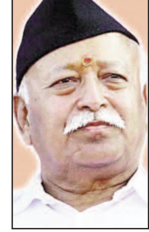
काम कर रहे हैं चाहे वे संघी हो या कम्युनिस्ट। वार्षिक आरएसएस विजयदशमी उत्सव को संबोधित

मैलिनोस और कॉकर स्पैनियल शामिल हैं। इन कुत्तों के साथ एक हैंडलर की भी तैनाती की जाती है। प्रधानमंत्री नरेंद्र मोदी पहले भी साइंटिफिक तरीके से देसी नस्ल के कुत्तों को आर्मी, सुरक्षा बल और पुलिस में शामिल करने और उन्हें बढ़ावा देने की बात कह चुके हैं। गौरतलब है कि बीएसएफ, आईटीबीपी और सीआरपीएफ को पर्वतीय कुत्तों को एक साथ ट्रेनिंग देने के लिए आदेश जारी किया गया है। ट्रेनिंग पूरी होने के बाद इन नस्लों को उनकी विशेषताओं के अनुसार तैनाती भी दी जाएगी। सीमा सुरक्षा बल, केंद्रीय