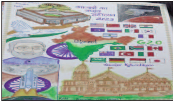
प्रतियोगिता में विद्यार्थी द्वारा बनाई गई ड्राइंग