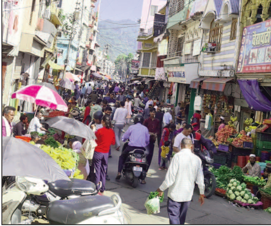
कोटद्वार के गोखले मार्ग पर अतिक्रमण के कारण लगा जाम

शहर में यातायात व्यवस्था सुधारने के लिए पुलिस ने सोमवार को गोखले मार्ग में अतिक्रमण हटाओ अभियान चलाया था। अभियान के दौरान पुलिस ने अतिक्रमणकारियों को सख्त हिदायत दी। लेकिन, मंगलवार को हालत पूर्व की तरह ही नजर आए। सड़क के दोनों ओर रेहड़ी-फड की दुकानें सजी हुई थीं।