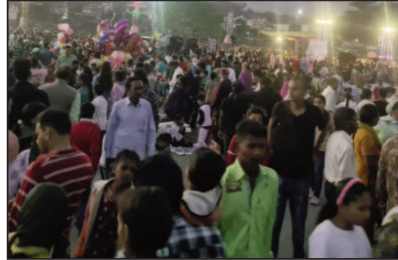
दशहरा मेले में उमड़ी लोगों की भीड़।

ग्रास्टनगंज में आयोजित दशहरे मेले में मंगलवार सुबह से ही दुकानों व फड़ सजने लगी। इस दौरान लोगों की मेले में खूब चहल पहल रही। शाम ढलने के साथ ही ग्रास्टनगंज स्थित दशहरा मेला स्थल खराब खराब भर गया। देर शाम नगर क्षेत्र की दो रामलीला कमेटियों की ओर से बनाए गए रावण के दो अलग-अलग पुतलों का दहन किया गया।