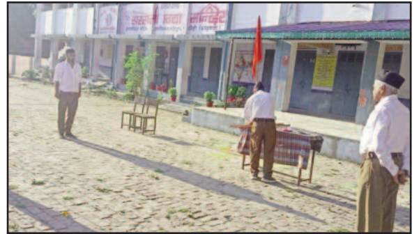
आयोजित कार्यक्रम में भाग लेते स्वयं सेवी