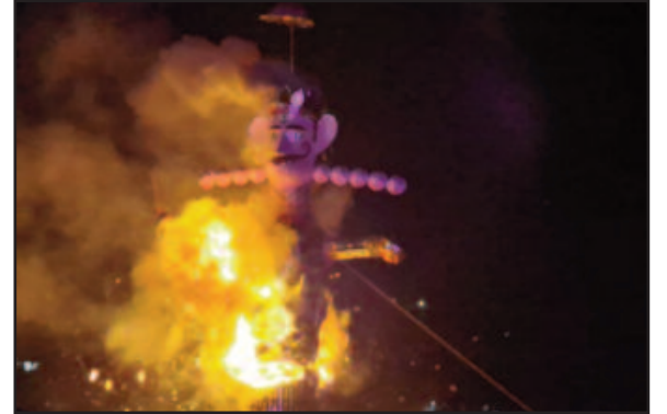
ग्रास्टनगंज में रावण का पुतला जलता हुआ।

जयकारों से गुंजन लगा। दशहरा समाप्त होने के बाद गाड़ीघाट क्षेत्र में लंबा जाम भी देखने को मिला। जाम खुलवाने के लिए पुलिस कर्मियों को कड़ी मशक्कत करनी पड़ी। इस मौके पर मुख्य अतिथि विधानसभा अध्यक्ष ऋतु खण्डूडी