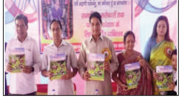
आयोजित कार्यक्रम में भाग लेते सदस्य