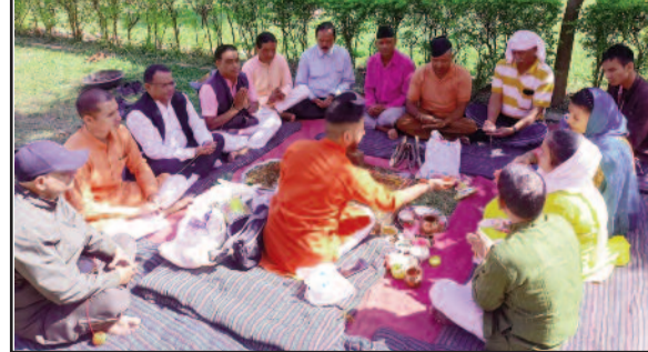
कोटद्वार में तल्ला मोटाढाक स्थित बलूनी पब्लिक स्कूल में आयोजित कार्यशाला के दौरान हवन में शामिल स्वयंसेवी।