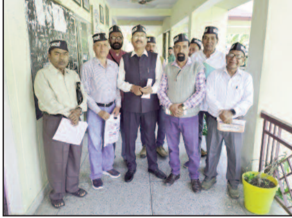
कोटद्वार तहसील में विभिन्न समस्याओं को लेकर उपजिलाधिकारी कार्यालय पहुंचे समिति के सदस्य

अधुनिक बस अड्डे के नाम पर मोटर नगर में केवल एक गड्डा ही नगर आ रहा है। अतिक्रमण हटाने के बाद भी पैदल चलने के लिए फुटपाथ नहीं बनाए गए हैं। शहर में पार्किंग व्यवस्था नहीं होने से