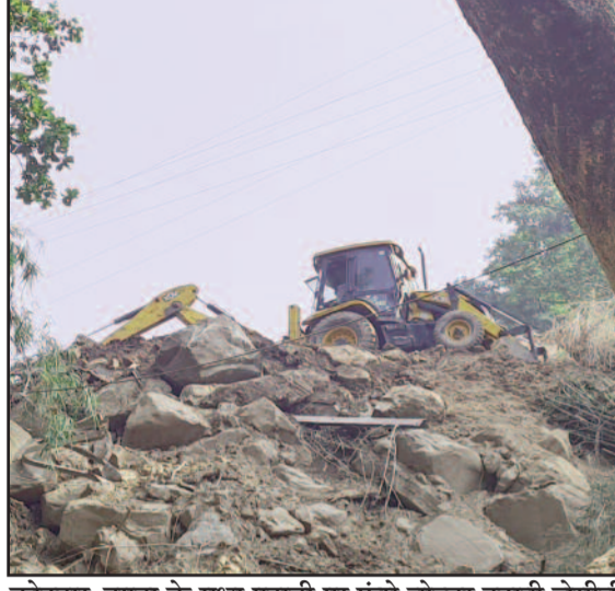
कोटद्वार-दुगड्डा के मध्य पहाड़ी पर फंसे बोल्टर हटाती जेसीबी

राजमार्ग कोटद्वार-दुगड्डा के मध्य जगह-जगह बदहाल हो गया था। राष्ट्रीय राजमार्ग विभाग को पहाड़ी से आए मलबे व बोल्टर को हटाने के लिए कड़ी मशकत करनी पड़ी। कई