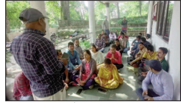
कोटद्वार में आयोजित बैठक में भाग लेते आउटसोर्स वन कर्मी

कोटद्वार : पिछले चार माह से वेतन का भुगतान नहीं होने पर आउटसोर्स कर्मियों ने रोष व्यक्त किया है। कहा कि वेतन नहीं मिलने से कर्मचारियों के समक्ष आर्थिक संकट खड़ा हो गया है। पूर्व में आशवासन के बाद भी विभाग समस्या को लेकर गंभीरता नहीं दिखा रहा। बुधवार को कार्बेट टाइगर रिसेप्शन सेंटर के स्वागत कक्ष में दैनिक संविदा, आउटसोर्स कर्मचारी संघ के कालागढ़ टाइगर रिजर्व वन प्रभाग, लैंसडौन वन प्रभाग व भूमि संरक्षण वन प्रभाग के कर्मियों