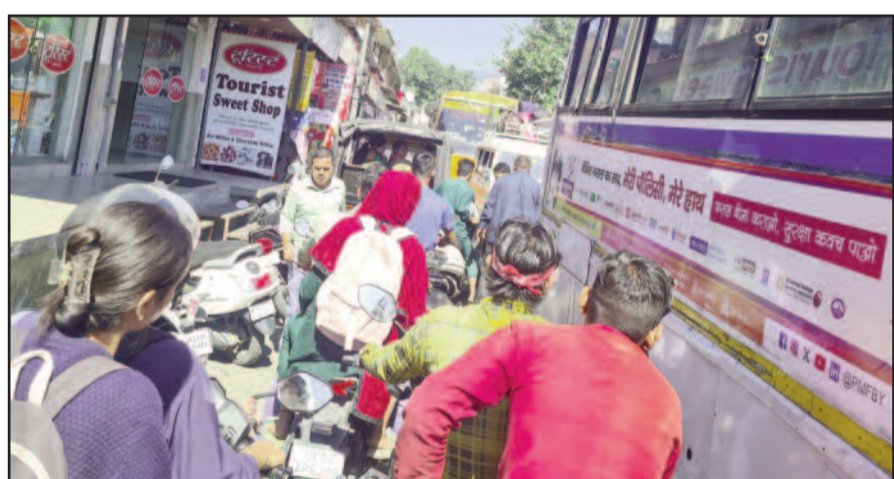
गुरुवार को कोटद्वार के स्टेशन रोड में लगा जाम

जयन्त प्रतिनिधि कोटद्वार : शादी सीजन में शहर की यातायात व्यवस्था बेपटरी होने लगी है। जाम के कारण आमजन का सड़क पर बेतरतीब खड़े वाहन शहर में जाम का मुख्य कारण सड़कों पर बेतरतीब तरीके से खड़े वाहन बन रहे हैं। कई व्यक्ति अपने वाहनों को सड़क पर खड़ा कर बाजार पैदल घूमने चले जाते हैं। जिससे अन्य वाहनों को निकलने के लिए पर्याप्त रास्ता नहीं मिल पाता। इस अव्यवस्था के कारण कई बार दुर्घटनाओं का भी अंदेशा बना रहता है। जबकि, पूर्व में शहरवासी कई बार व्यवस्थाओं में सुधार की मांग उठा चुके हैं।