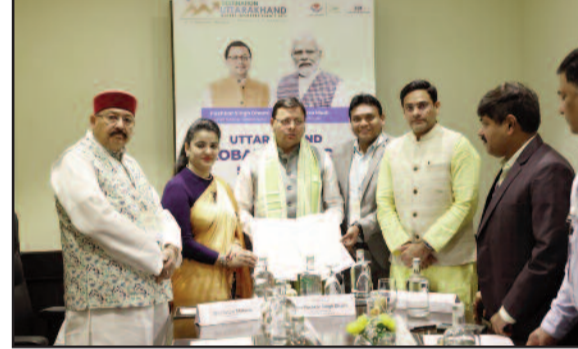
चेन्नई में एमओयू करते हुए मुख्यमंत्री पुष्कर सिंह धामी।

उन्होंने कहा कि तमिलनाडु और उत्तराखंड का आध्यात्मिक रूप से संबंध है। तमिलनाडु में रामेश्वरम और उत्तराखंड में श्री केदारनाथ एवं आदि कैलाश विश्व प्रसिद्ध हैं। कहा कि भगवान शिव के तमिलनाडु में