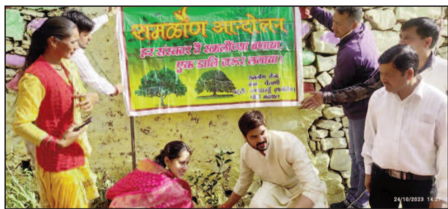
नवदंपति राठ महाविद्यालय पैठाणी में समलौण पौधा रोपते हुए।