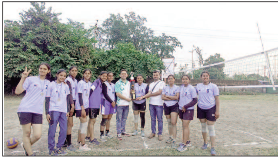
आयोजित प्रतियोगिता में प्रतिभाग करने वाली कोटद्वार महाविद्यालय की टीम