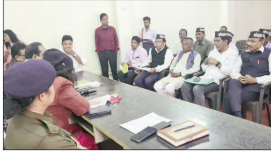
कोटद्वार तहसील सभागार में बैठक करते समिति के सदस्य व अधिकारी

गठन के पांच वर्ष बाद भी समस्याएं जस की तस बनी हुई हैं। सड़कों पर लगातार गोवंशों की संख्या बढ़ती जा रही है। यही नहीं आवारा गोवंशों के हमले में कई व्यक्ति अपनी जान भी गंवा चुके हैं। बावजूद नगर निगम के काम में जूं तक नहीं रेंग रहा। उक्त समस्या पर सहायक नगर आयुक्त ने बताया कि वर्तमान में गो रेस्क्यू वाहन खराब पड़ा हुआ है। जल्द ही इसकी मरम्मत करवाकर बीस दिन के भीतर गोवंशों को गौशाला में शिप्ट किया जाएगा। समिति ने नगर निगम से अपने गोवंशों को सड़क पर छोड़ने वालों के खिलाफ भी कानूनी कार्रवाई करने की मांग उठाई। सहायक नगर आयुक्त ने शहर के सीवर ट्रीटमेंट और कूड़ा निस्तारण के लिए यूपी से भूमि