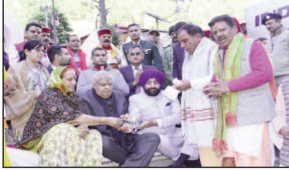
उप राष्ट्रपति जगदीप धनखड़ गंगोत्री धाम में पूजा करते हुए।