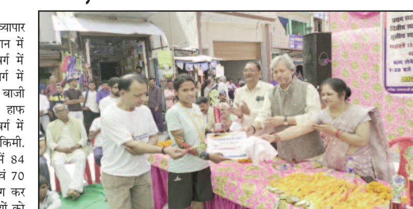
गढ़वाल सांसद एवं पूर्व मुख्यमंत्री तीरथ सिंह रावत विजेता प्रतिभागियों को सम्मानित करते हुए।