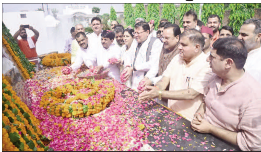
सीएम पुष्कर सिंह शहीद स्थल रामपुर तिराहा में शहीद आंदोलनकारी को श्रद्धांजलि देते हुए।

◆ शहीद स्थल, रामपुर तिराहा में उत्तराखंड के स्थानीय उत्पादों की होगी उपलब्धता ◆ मुख्यमंत्री ने शहीद स्थल रामपुर तिराहा में राज्य आंदोलनकारी शहीदों को दी श्रद्धांजलि