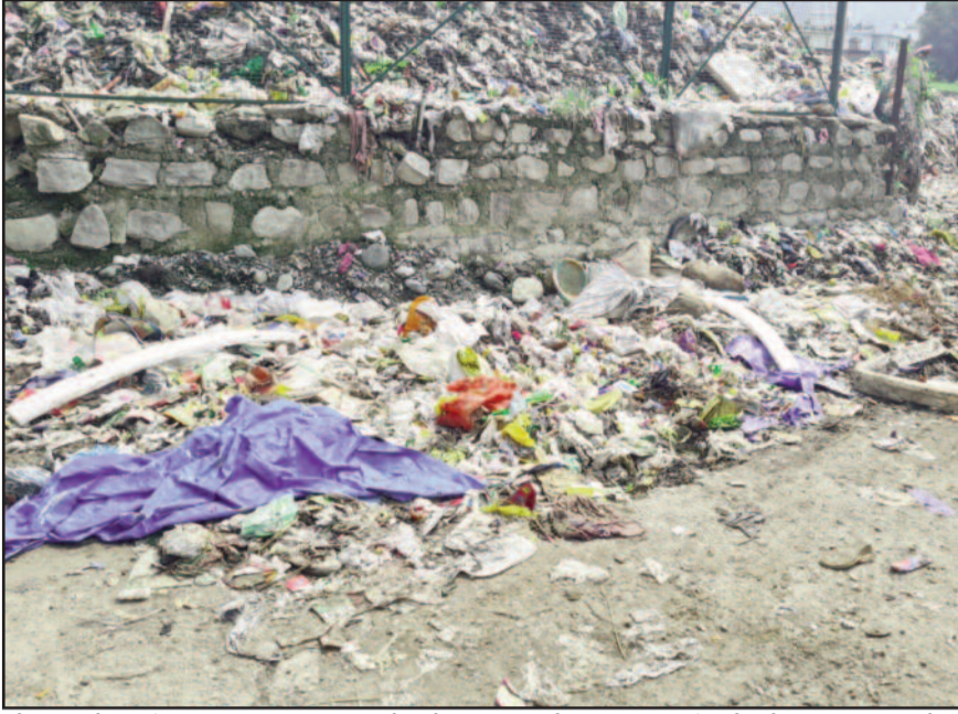
कोटद्वार के गाड़ीघाट स्थित मुक्तिधाम के प्रवेश द्वार पर सेवा समिति की ओर से लगाया गया पोस्टर

की राह में बाधा बन रही है। नतीजा दुर्गम के कारण जहां मंदिर में भक्ति करना भी मुश्किल हो जाता है, वहीं, शव दाह करना भी एक चुनौती बन जाती है।