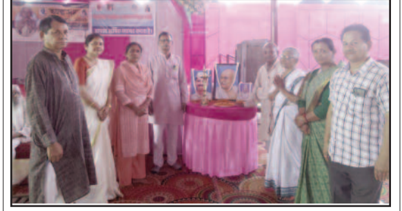
महात्मा गांधी व लालबहादुर शास्त्री को श्रद्धांजलि देते सदस्य