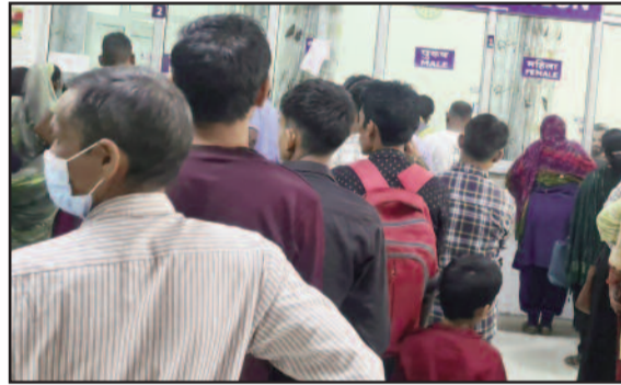
कोटद्वार के राजकीय बेस चिकित्सालय में पची बनवाने के लिए लगी लोगों की लंबी लाइन

निजी अस्पतालों में वायरल मरीजों की संख्या कम होने का नाम नहीं ले रही। चिकित्सक मरीजों को स्वास्थ्य के प्रति जागरूक रहने की सलाह दे रहे हैं। जरा सी लापरवाही आमजन के स्वास्थ्य पर भारी पड़ रही है।