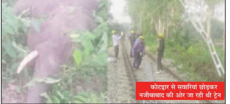
कोटद्वार से सवारियां छोड़कर नजीबाबाद की ओर जा रही थी ट्रेन