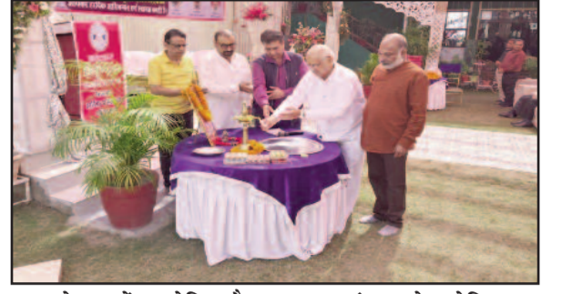
कोटद्वार में आयोजित बैठक का शुभारंभ करते एसोसिएशन के पदाधिकारी।