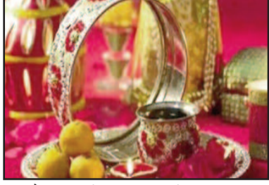
हाई सौ वर्ष पहले घटी घटना के बाद शुरूआत में जिस महिला ने करवा चौथ मनाया उसे ही अपने पति को खोना पड़ गया। आठ नौ इस प्रकार की मौत होने से महिलाओं के विधवा होने के बाद से इस क्षेत्र में इस त्योहार का मनाया बंद हो गया। गांव की 102 वर्षीय

मथुरा, एजेंसी। देशभर में जहां विवाहिता महिलाओं के लिए एक ओर करवा चौथ का व्रत बेहद महत्वपूर्ण है वहीं दूसरी ओर उत्तर प्रदेश के मथुरा जिले में एक तहसील ऐसी भी है जहां की विवाहिता महिलाएं चाहकर भी इस व्रत को नहीं करती हैं। मथुरा जिले की मांट तहसील के सुरीर बिजउ गांव के बधा विवाहित महिलाओं द्वारा अपने पति की दीर्घ आयु की कामना के लिए किया जाने वाला करवा चौथ का व्रत मथुरा जिले की मांट तहसील के सुरीर बिजउ गांव के बधा विवाहित महिलाओं द्वारा अपने पति की दीर्घ आयु की कामना के लिए किया जाने वाला करवा चौथ का व्रत मथुरा जिले की मांट तहसील के सुरीर बिजउ गांव के बधा विवाहित महिलाएं नहीं रखती हैं। इसका मुख्य कारण एक सती का इस क्षेत्र के लोगों को दिया गया श्राप है। गांव के बड़े बुजुर्ग बताते हैं कि लगभग