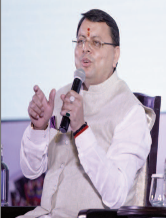
मुख्यमंत्री पुष्कर सिंह धामी दिल्ली में रोड शो के दौरान संबोधित करते हुए।

अटल बिहारी वाजपेई द्वारा उत्तराखण्ड को औद्योगिक पैकेज स्वीकार किये जाने से राज्य में औद्योगिक वातावरण के सृजन में मदद मिली। 2014 से पूर्व के कुछ वर्षों में यद्यपि इसमें कुछ व्यवधान रहा, किन्तु 2014 के बाद प्रधानमंत्री नरेंद्र मोदी के मार्गदर्शन में राज्य में सभी क्षेत्रों में तेजी से विकास हो रहा है तथा 1.50 लाख करोड़ की विभिन्न योजनाओं पर कार्य किया जा रहा है। मुख्यमंत्री ने कहा कि आज उत्तराखण्ड विश्वस्तरीय पसंदीदा पर्यटन गंतव्य बन रहा है। अब तक राज्य में 44 लाख लोग चार घाम यात्रा पर आ चुके हैं। कांवड़ यात्रा में इस वर्ष 4.15 करोड़ शिव भक्त आये जबकि गत वर्ष यह संख्या 3.75 करोड़ रही थी। पर्यटन सीजन में राज्य के सभी होटल, होम स्टे आदि की फुल बुकिंग रही, यह राज्य के पर्यटन के लिये निश्चित रूप से शुभ संकेत है। उन्होंने कहा कि