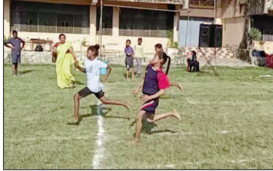
आयोजित प्रतियोगिता में प्रतिभाग करते विद्यार्थी

राजकीय स्टेडियम कोटद्वार में प्रतियोगिताओं का आयोजन किया जा रहा था। प्रतियोगिता के अंतिम दिवस पर आयोजित विभिन्न प्रतियोगिताओं के फाइनल मैचों में प्राथमिक स्तर की 50 मी. दौड़ में आदर्श प्राथमिक विद्यालय मोटढाक, 100 मी. में प्राथमिक विद्यालय न. 1 नगर क्षेत्र, 200 मी. में राप्तिव सक्न्याणी और 400 मी. दौड़ में क्रेडल पब्लिक स्कूल निंबूचौड़ ने पहला स्थान प्राप्त किया। जूनियर स्तर की 100 मी. दौड़ में राप्तिव उमरैला,