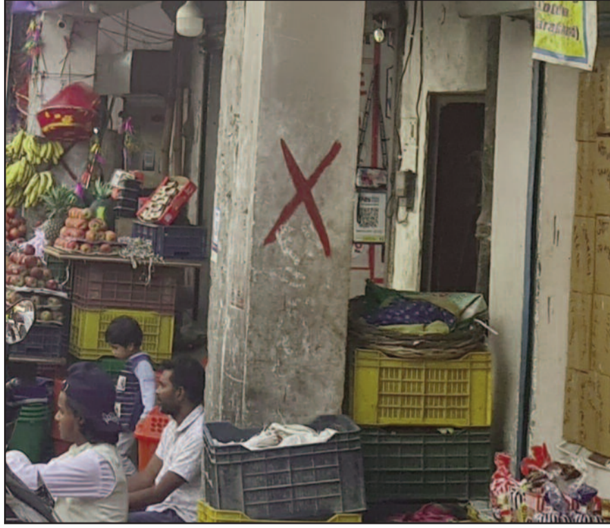
कोटद्वार के गोखले मार्ग पर अतिक्रमण पर लगा लाल निशान।

एक दिन अतिक्रमण के खिलाफ कार्रवाई करने के बाद