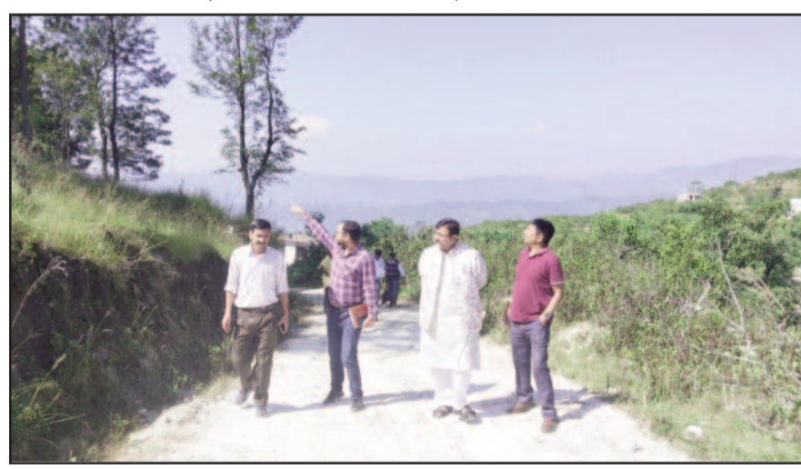
धुमाकोट में गोशाला के लिए भूमि का निरीक्षण करते आयोग के अध्यक्ष व अन्य

गोसेवा आयोग के अध्यक्ष ने बताया कि तहसील प्रशासन की ओर से सुझाई गई भूमि का निरीक्षण किया गया है। करीब 15 नाली भूमि में गोशाला बनाने का प्रस्ताव है। भूमि उपलब्ध होते ही राजस्व विभाग की ओर से डीपीआर तैयार कर शासन को भेजा जाएगा। इससे लोगों को