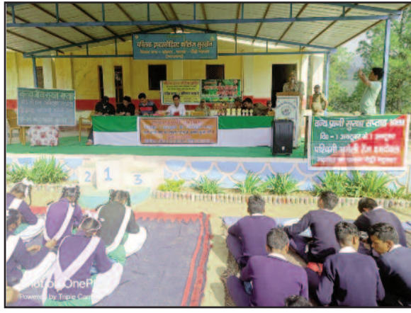
आयोजित कार्यशाला में भाग लेते विद्यार्थी

कोटद्वार : एकेश्वर विकासखंड के पब्लिक इण्टर कालेज सुरखेत में दमदेवल रेंज की पहल पर वन्यजीव सुरक्षा सप्ताह के तहत आयोजित कार्यक्रम के दौरान छात्र-छात्राओं को वनों और वन्यजीवों के प्रति जागरूक करने के साथ ही निबन्ध, पोस्टर और विक्व प्रतियोगिताएं आयोजित की गयीं।