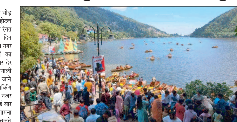
सैलानियों से गुलजार हुआ नैनीताल स्थल सैलानियों से गुलजार रहे। स्नो व्यू, चिड़ियाघर, केव गार्डन, सैलानियों की भीड़ उमड़ने से पर्यटन हिमालय दर्शन, संख्या में यहां पहुंच रहे हैं।

नैनीताल। वीकेंड पर सैलानियों की भीड़ उमड़ने से सरोवर नगरी के अधिकांश होटल पैक हो गए हैं। जिसके चलते नगर की रंगत में निखार आ गया है। दशहरा तक दिन सैलानियों की आमद में बढ़ोतरी रहेगी। नगर सैर के लिए शुक्रवार से सैलानियों का पहुंचना शुरू हो गया था, जो शनिवार देर शाम तक जारी रहा। काफी संख्या में बंगाली सैलानी पहुंचे हुए हैं। पार्किंग फुल हो जाने से नगर का यातायात प्रभावित हुआ। पार्किंग की तलाश में सैलानी मशकत करते नजर आए। चिड़ियाघर व स्नो व्यू मार्ग में कई बार जाम लगने से लोगों को परेशानी का सामना करना पड़ा। लगातार बढ़ते लोगों के चलते यहां पर जाम की भी समस्या खड़ी हो रही है।