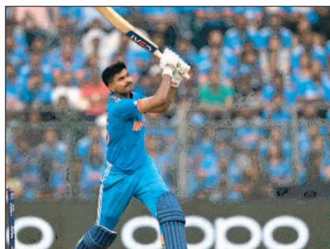
अंतरराष्ट्रीय क्रिकेट करियर

नई दिल्ली। भारत के मध्यम के धाकड़ बल्लेबाज श्रेयस संतोष अय्यर का जन्म 6 दिसंबर 1994 को मुंबई में हुआ। उनके पिता संतोष अय्यर तमिलियन हैं और उनकी मां रोहिणी तुलुवा हैं। उनके पूर्वज केरल के त्रिशूर से हैं। श्रेयस अय्यर की कमाई लगभग 70 करोड़ रुपये सालाना है। वह दाएं हाथ के बल्लेबाज हैं। घरेलू क्रिकेट में श्रेयस अय्यर ने 139 मैच की 131 पारियों में 5490 रन बनाए हैं। अय्यर ने 47.32 की औसत और 97.73 की स्ट्राइक रेट से 12 शतक और 34 अर्धशतक ठोके हैं। अय्यर घरेलू क्रिकेट में मुंबई के लिए खेलते हैं। 18 साल की उम्र में अय्यर को कोच प्रवीण आमरे ने शिवाजी पार्क जिमखाना में देखा था। आमरे ने उन्हें क्रिकेट के शुरुआती दिनों में प्रशिक्षित किया था। उन्होंने 2014 आईसीसी अंडर-19 क्रिकेट विश्व कप में भारत अंडर-19 क्रिकेट टीम के लिए खेला था। उन्हें 2023 क्रिकेट विश्व कप के लिए भारतीय टीम में शामिल किया गया और नीदरलैंड्स के खिलाफ अपना पहला वर्ल्ड कप शतक जड़ा। इसके बाद न्यूजीलैंड के खिलाफ सेमीफाइनल में लगातार दूसरा शतक जड़ा।