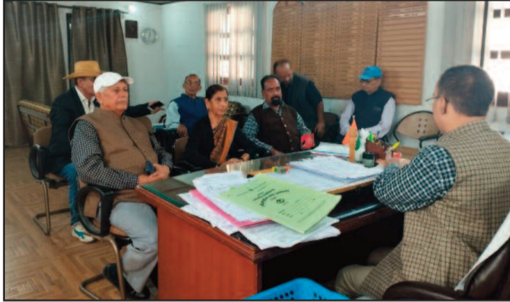
कोटद्वार में डीएफओ से मुलाकात करते समितियों के सदस्य