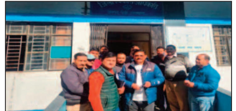
काला फीता बांधकर आक्रोश जताते कर्मचारी