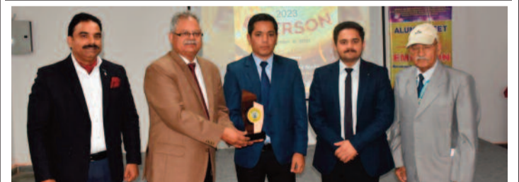
आईएचएमएस में पूर्व विद्यार्थियों को सम्मानित करते सदस्य व अन्य

आईएचएमएस में आयोजित किया गया पूर्व छात्र मिलन समारोह