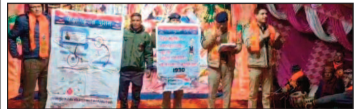
डडोली गांव में रामलीला मंचन के दौरान जागरूक करती पुलिस