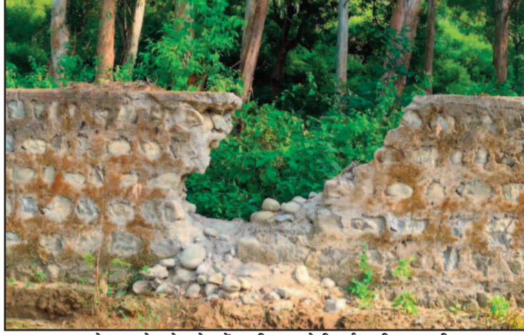
कोटद्वार के सनेह क्षेत्र में हाथी द्वारा तोड़ी गई हाथी सुरक्षा दीवार

सनेह, कुंभीचौड़ व रामपुर का आधिकांश भाग लैंसडौन वन प्रभाग से सटा हुआ है। नतीजा आए दिन जंगली जानवर आबादी में पहुंच रहे हैं। आबादी में जंगली जानवरों की धमक को रोकने के लिए क्षेत्र में लाखों की लागत से सुरक्षा दीवार व फेंसिंग लाइन भी बिछाई गई थी। लेकिन, वर्तमान में यह भी केवल शोपीस बनी हुई है। कुंभीचौड़ वासियों ने बताया कि शाम ढलते ही कई बार हाथी व गुलदार सड़क पर