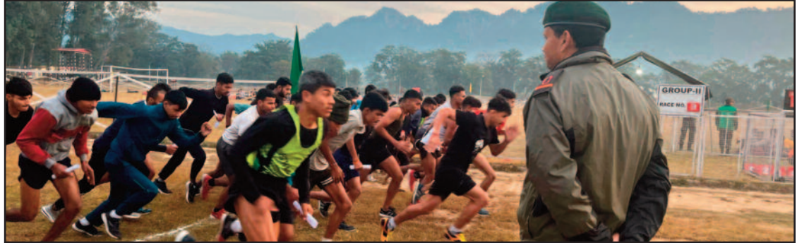
अग्निवीर भर्ती रैली की 1600 मी. दौड़ में दमखम दिखाते हुए युवा।