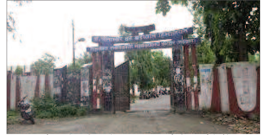
राजकीय स्नातकोत्तर महाविद्यालय कोटद्वार जहां छात्रसंघ चुनाव की अधिसूचना जारी हो गई है।

छः नवंबर को प्रत्याशियों की प्रधानाचार्य, स्थानीय प्रशासन की बैठक होगी। सात नवंबर को सुबह आठ बजे से मतदान शुरू होगा। दोपहर दो बजे से