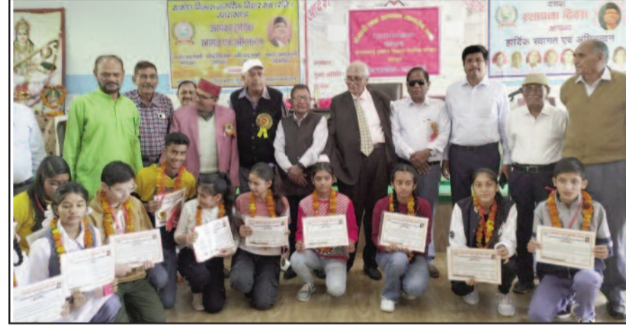
कोटद्वार में विचार मंच की ओर से सम्मानित किए गए विद्यार्थी