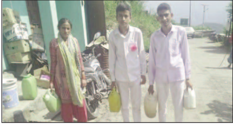
पानी के लिए भटकते ग्रामीण बच्चे

हेंवल नदी से गांव तक पेयजल लाइन बिछाई गई। लेकिन, पिछले डेढ़ माह से हाईड्रम मशीन ठीक से कार्य नहीं कर रही। ऐसे में गांव तक पर्याप्त पानी नहीं पहुंच पा रहा है।