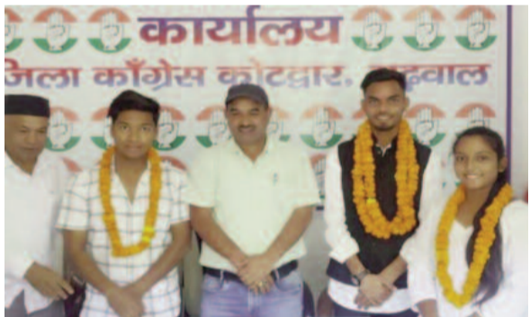
एनएसयूआई के प्रत्याशियों का स्वागत करते काँग्रेसी