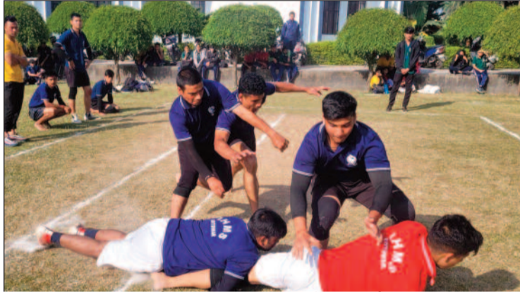
कबड्डी प्रतियोगिता में दमखम दिखाते हुए खिलाड़ी।