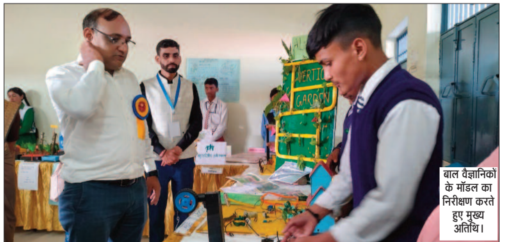
बाल वैज्ञानिकों के मॉडल का निरीक्षण करते हुए मुख्य अतिथि।