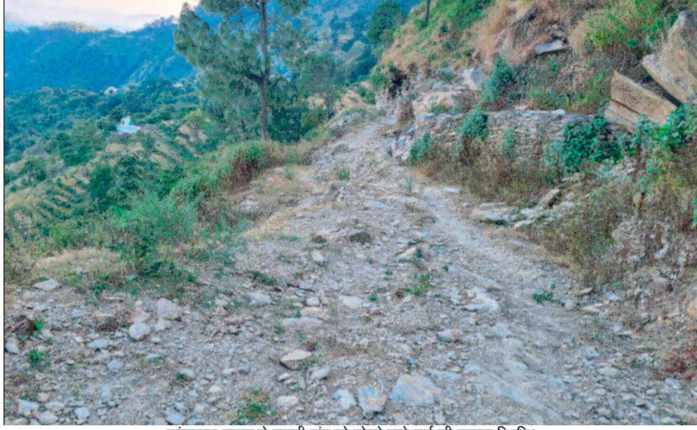
कांडाखाल बाजार से बनानी गांव को जोड़ने वाले मार्ग की बद्दहाल स्थिति।