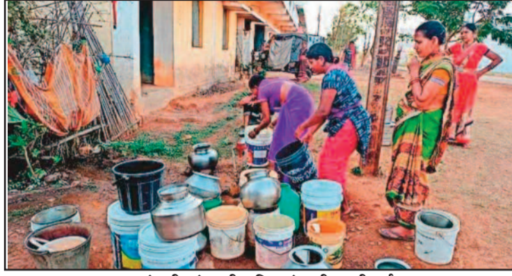
बंगानी गांव की महिलाएं पानी भरती हुईं।