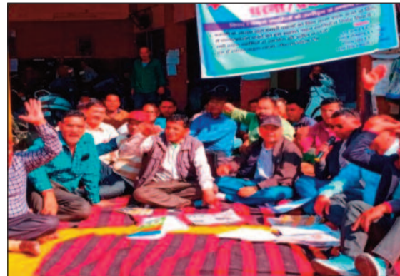
कंपनी के खिलाफ धरना देते वाहन स्वामी

जयन्त प्रतिनिधि। कोटद्वार : यातायात कंपनी जीएमओयू लि. के वाहन स्वामियों ने कंपनी अध्यक्ष पर उनके साथ तानाशाही रवैया अपनाने का आरोप लगाया है। इस बात से आक्रोशित वाहन स्वामियों ने कंपनी परिसर में धरना प्रदर्शन किया।