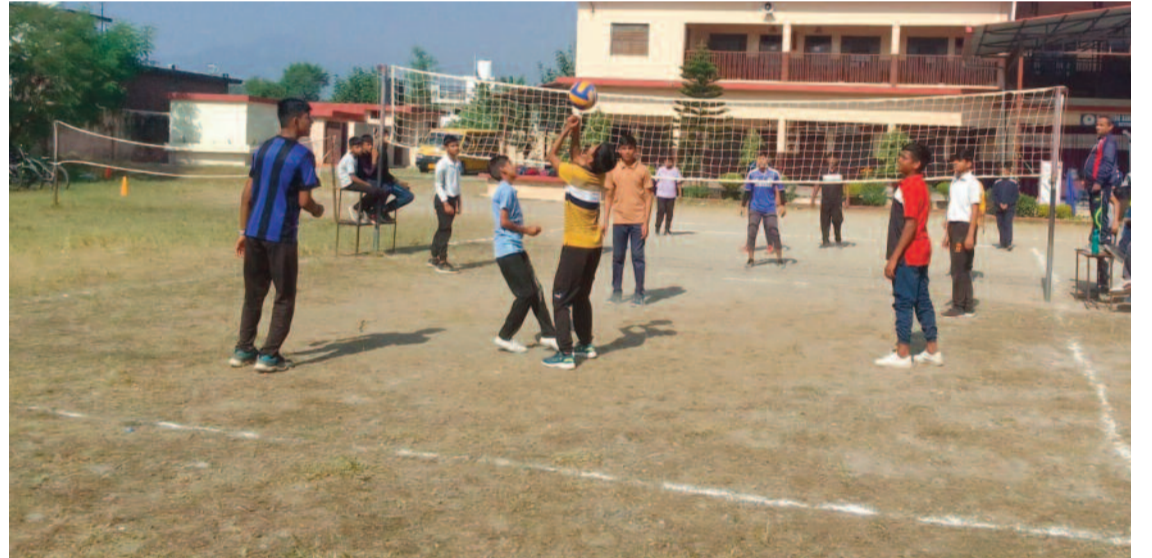
एसजीआरआर लालपानी में वॉलीबॉल प्रतियोगिता में जुड़ते हुए खिलाड़ी।