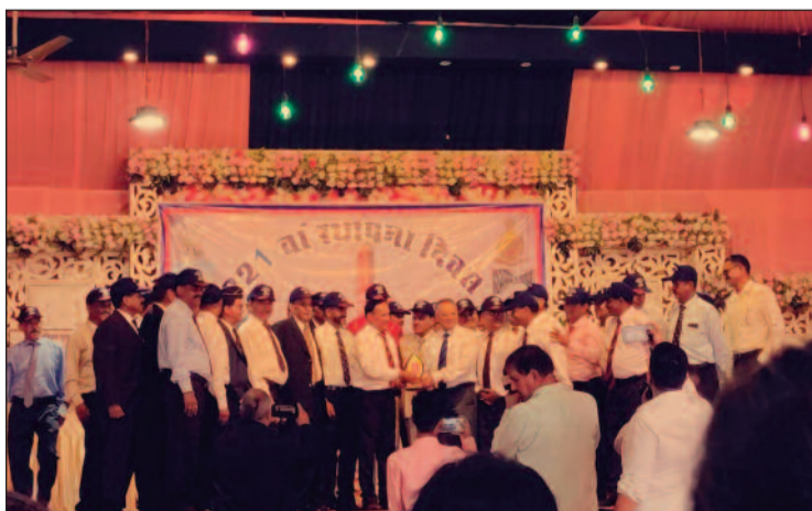
कोटद्वार में आयोजित कार्यक्रम में भाग लेते सदस्य

जयन्त प्रतिनिधि। कोटद्वार : बंगाल इंजीनियर ग्रुप समिति की ओर से बंगाल इंजीनियर ग्रुप का 221वां स्थापना दिवस धूमधाम के साथ मनाया गया। ग्रुप से जुड़े