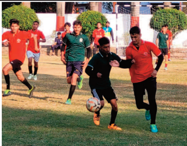
कोटद्वार में आयोजित प्रतियोगिता में प्रतिभाग करते खिलाड़ी