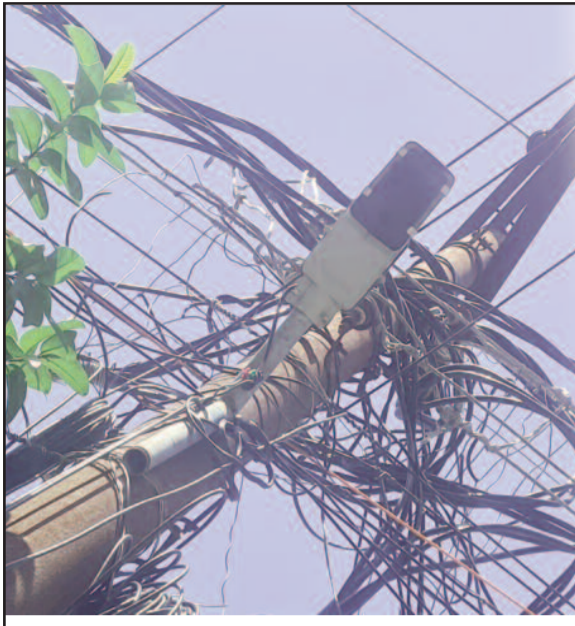
कोटद्वार नगर निगम क्षेत्र में सड़क किनारे लगी स्ट्रीट लाइट