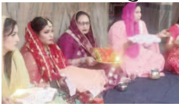
कोटद्वार के गीता मंदिर में पूजा अर्चना करती सुहागन

जयन्त प्रतिनिधि । कोटद्वार : कोटद्वार व आसपास के क्षेत्र में करवा चौथ पर्व हर्षोल्लास के साथ मनाया गया। सुहागिनों ने निर्जला व्रत रखकर रात के समय चांद का दीदार कर अपने पति की लंबी उम्र की कामना की। करवा चौथ को लेकर बाजार में काफी उत्साह देखने को मिला। वहीं, गोविंद नगर स्थित गीता मंदिर में विशेष पूजा-अर्चना की गई। बुधवार को सुबह से ही महिलाएं व्रत की तैयारियों में जुटी हुई थीं। महिलाओं ने मंदिरों में पूजा-अर्चना के साथ ही कीर्तन भी किया। इस दौरान शहर के बाजारों में भी महिलाओं की