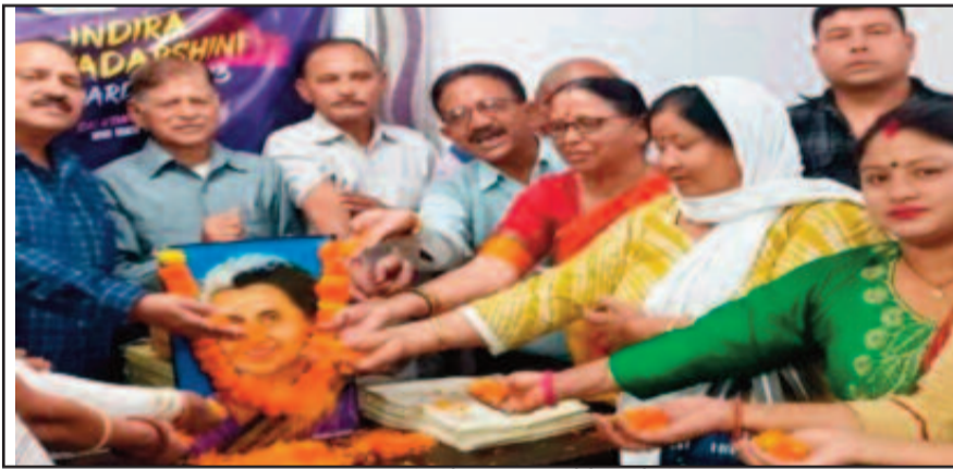
इंदिरा गांधी को श्रद्धांजलि देते कांग्रेसी

इस अवसर पर वक्ताओं ने कहा कि उनका जन्म 19 नवम्बर 1917 को हुआ था। उन्हें विश्व भर के सर्वश्रेष्ठ विश्वविद्यालयों द्वारा डॉक्टरेट की उपाधि से सम्मानित किया गया था। वे शुरू से ही स्वतंत्रता संग्राम में सक्रिय रहीं। उन्होंने असहयोग आंदोलन के दौरान कांग्रेस पार्टी की सहायता के लिए 1930 में बच्चों के सहयोग से 'वानर सेना का निर्माण