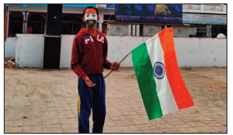
अपने चेहरे पर तिरंगा बनाकर पहुंचा क्रिकेट प्रेमी

वर्ल्ड के दौरान किसी तरह का हुड़दंग न हो इसके लिए मौके पर पुलिस टीमों भी तैनात की गई थी।