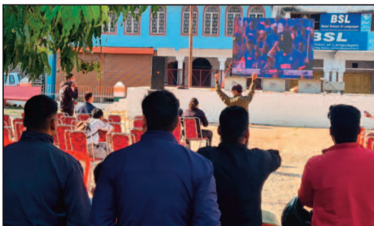
कोटद्वार के मालवीय उद्यान में बड़ी स्क्रीन में मैच का लुप्त उठाते दर्शक