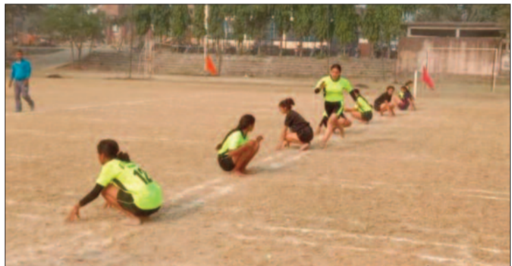
कोटद्वार के स्टेडियम में आयोजित प्रतियोगिता में प्रतिभाग करते खिलाड़ी