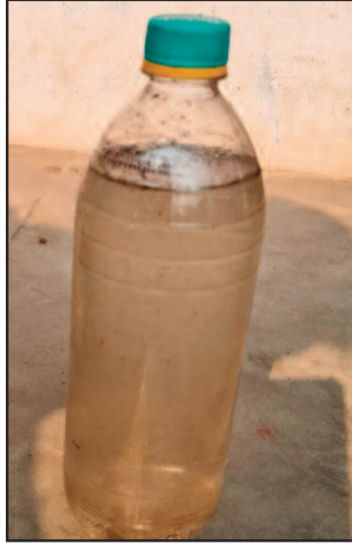
कोटद्वार के काशीरामपुर तल्ला में बोटल में भरा दूषित पानी

काशीरामपुर तल्ला क्षेत्र के लिए बिछाई गई पेयजल लाइन जगह-जगह क्षतिग्रस्त स्थिति में पड़ी हुई है। नतीजा गंदी नालियों से गुजर रही पेयजल लाइन