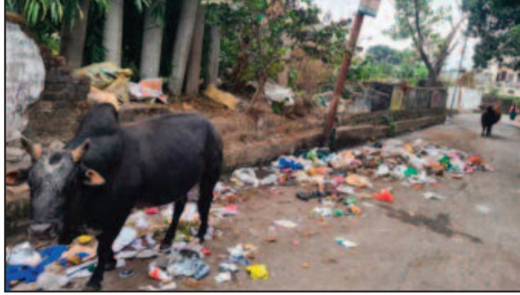
कोटद्वार में पदमपुर के समीप सड़क किनारे लगे गंदगी के ढेर

घर-घर से कूड़ा एकत्रित करने के लिए नगर निगम की ओर से प्रत्येक वार्ड में वाहनों का संचालन किया जाता है। लेकिन, अब भी कई व्यक्ति वाहनों में कूड़ा डालने के बजाय इसे सड़क किनारे ही फेंक रहे हैं। नतीजा, आमजन की यह लापरवाही शहर की स्वच्छता पर कलंक बन रही है। कई स्थानों पर दोपहर तक गंदगी के ढेर लगे रहते हैं। ऐसे में राहगीरों का सड़क पर पैदल चलना भी मुश्किल हो जाता है। सबसे